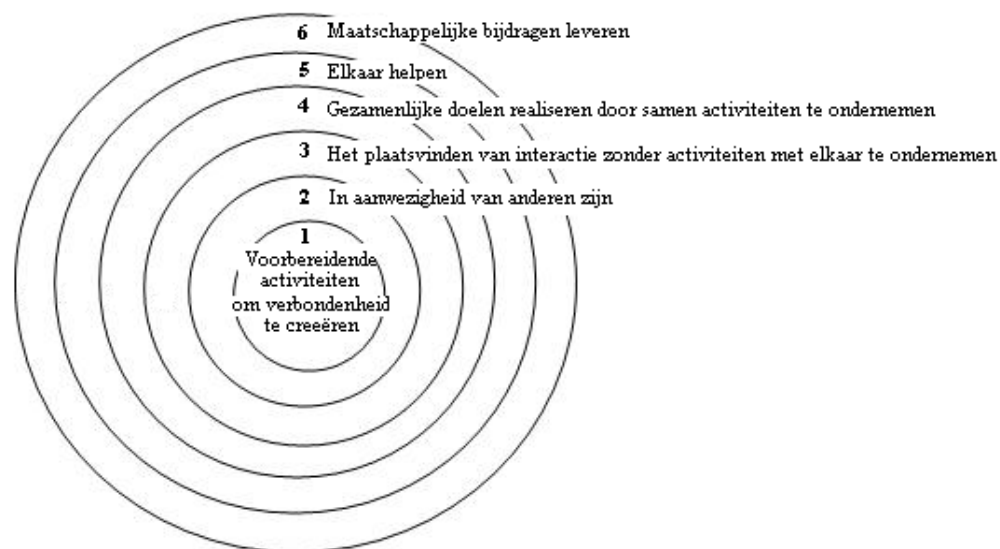
Figuur 3.1: Maatschappelijke participatieniveaus van Levasseur en Gauvin (2010).

In figuur 3.1 worden de verschillende participatieactiviteiten weergegeven. De eerste drie participatieactiviteiten vinden plaats zonder directe fysieke sociale interacties. Er is enige afstand tussen de burgers bij het ondernemen van activiteiten omdat deze bijvoorbeeld via het internet plaatsvinden. De laatste participatievorm bestaat uit activiteiten die in een brede context kunnen worden geplaatst. Het gaat hier om de participatievorm maatschappelijke bijdragen leveren . Deze vorm van participatie kan niet direct in relatie worden gebracht op het individuele niveau omdat de resultaten niet direct zichtbaar zijn. Dit komt omdat burgers onderdeel uitmaken van een organisatie waarbij de resultaten van de gezamenlijke activiteiten in samenwerkingsverband tot stand komen. De participatievormen 4) gezamenlijke doelen realiseren door samen activiteiten te ondernemen en 5) elkaar helpen bestaan uit activiteiten die zijn gericht de sociale rol die iemand kan innemen in persoonlijke situaties op een bepaald tijdstip en op een bepaalde plek. Mogelijke voorbeelden van activiteiten kunnen zijn het verlenen van persoonlijke zorg en het verrichten van vrijwilligerswerk (Levasseur & Gauvin, 2010).