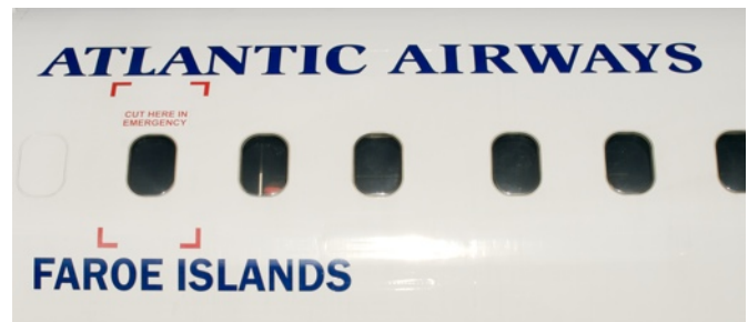
Atlantic Airways: de nationale luchtvaart maatschappij vliegt dagelijks op Kopenhagen