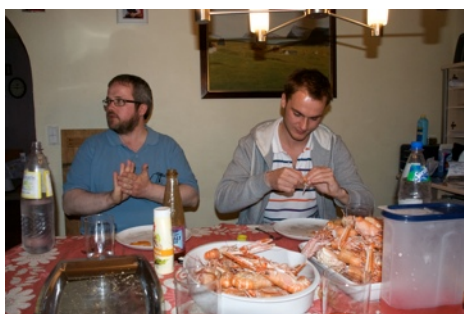
Participerende observatie: te gast bij een Faeröerse familie

De gegevens zoals ik die na mijn analyse hier presenteer zijn onder andere verkregen middels de voor culturele antropologie bekendste methode: participerende observatie. De uit deze methode verzamelde informatie is aangevuld met informatie verkregen uit andere kwalitatieve methoden zoals het houden van (diepte-) interviews en het verzamelen van (niet-wetenschappelijke) materiaal 6 . Het zijn dit soort methoden waarmee culturele antropologie zich onderscheidt ten opzichte van bijvoorbeeld sociologie of politicologie. Participerende observatie stelde mij in staat om in de natuurlijke omgeving ( being there ) gegevens te verzamelen en om te kijken en deel te nemen in gewone (alledaagse) en ongewone activiteiten van mijn onderzoekspopulatie (Dewalt &