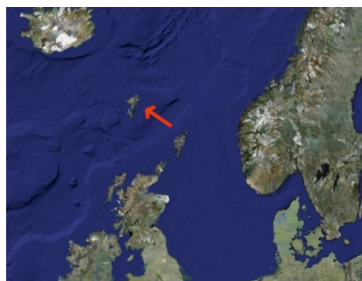
De Faeröer Eilanden liggen midden op de Noord Atlantische Oceaan (Google Earth)