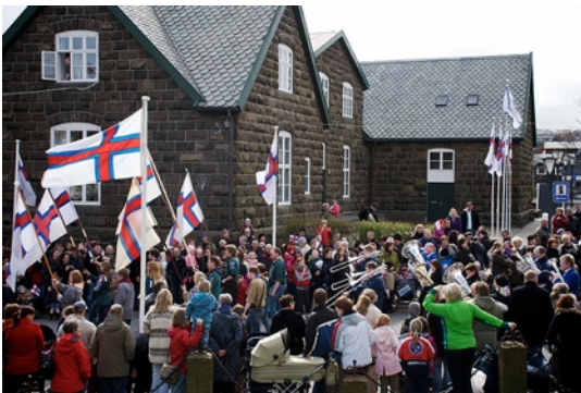
De vlaggentocht door het centrum van Tórshavn is een vast onderdeel van Flagdagur.

Kijkend naar de argumenten die genoemd worden in de onafhankelijkheidsdiscussie op de Faeröer Eilanden kan ik stellen dat de rol die een natie-staat kan spelen af kan hangen van de empirische situatie. Zo is het voor landen als Nederland, Frankrijk of de Verenigde Staten inderdaad