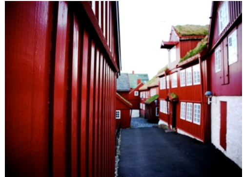
Tinganes: De parlamentsgebouwen in het oude gedeelte van Tórshavn. Hier had ik onder andere een interview met de minister-president.

Kijkend naar het aandeel van de verschillende partijen bij de meest recente verkiezingen kun je inderdaad concluderen dat de verhoudingen tussen de als pro-onafhankelijkheid bekend staande partijen ( Tjóðveldi , Fólkaflokkurin en Sjálvstýrisflokkurin ) en de wat meer gematigde partijen ( Sambandsflokkurin en Javnaðarflokkurin ) inderdaad zo goed als fifty-fifty 10 is. Waarschijnlijk is ook door het gehouden referendum in 1946 (47,2% tegen, 48,7% voor afscheiding van Denemarken) en de latere verkiezingsuitslagen dit beeld ontstaan. Dit op kwantitatieve data