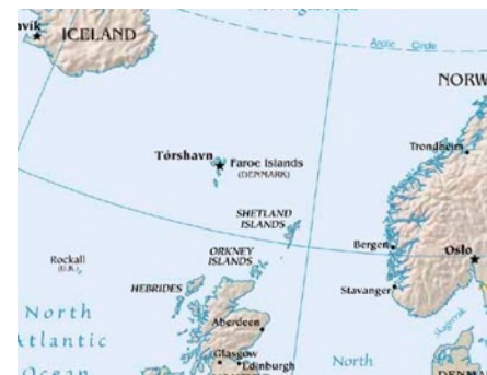
‘Faroe Islands (Denmark)’:

Zowel in de theoretisch discussie als in de praktijk is er dus de nodige scepsis over het nut van een natie-staat in het algemeen en in het stichten van een Faeröerse staat in het bijzonder. Toch zijn er verschillende auteurs die de macht en rol van de natie-staat in deze gemonialiseerde wereld nog steeds groot achten. Zo heeft Wolf (2001: 178) zijn twijfels over de mate van invloed van mondialisering op de natie-staat. Volgens hem is de toegenomen impotentie van nationale staten als gevolg van de mondialisering een van de grootste hedendaagse clichés. Volgens Wolf betekent de toegenomen mondialisering zeker niet de ondergang van de moderne natie-staat. Men name met behulp van kwantitatieve data laat hij zien dat de staat nog steeds in staat is om bijvoorbeeld belasting te heffen of op een positieve of negatieve manier invloed te hebben op de economische