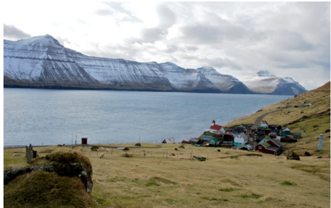
Het dorpje Kunoy waar ik overdag een bijeenkomst van Unga Tjóðveldi bijwoonde. De groep had het dorpshuis gereserveerd en onder het genot van pannenkoekjes en later ook biertjes werd besproken wat men allemaal ging doen komend jaar. 's Avonds ben ik met vijf leden nog uitgegaan in Klaksvík en de volgende dag reed ik de anderhalf uur durende rit weer terug naar Tórshavn.

dat zij samen met Tjóðveldi tijdens Flagdaggur , de nationale feestdag waarop de officiële erkenning van nationale vlag, de Merkið , in 1948 word herdacht, hadden opgevoerd. Er was een maquette van een weiland gemaakt met schaapjes. Er waren een paar schaapjes die omringt waren met een hek, deze kregen een typisch Deense lekkernij. De andere schaapjes, die andere landen moeten voorstellen, waren vrij en kregen deze Deense lekkernij niet. Deze