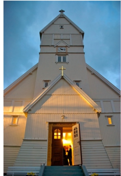
Kerk op het eiland Suðuroy

wederom een bredere wetenschappelijke discussie gekoppeld worden aan de empirische situatie zoals die voor mijn onderzoekslocatie geldt. Ditmaal zal ik de sociaal-culturele argumenten van de onafhankelijkheidsgezinde bevolking bespreken en zal ik deze argumenten plaatsen binnen grotere wetenschappelijke vraagstukken over nationale identiteit en nationalisme.