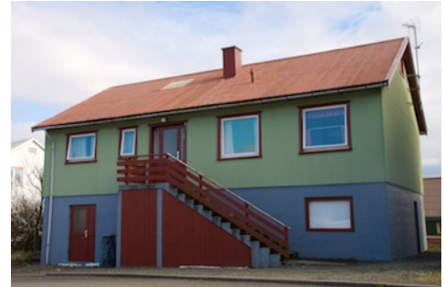
Mijn huis in de hoofdstad Tórshavn

gebaseerde beeld kan echter, zoals van een antropoloog verwacht mag worden, genuanceerd worden. De verhoudingen zijn in ieder geval niet zo zwart-wit als vaak voorgesteld. Onderzoek naar dit onderwerp zou met meer kwantitatieve methoden (enquêtes, vragenlijsten) zeker niet dezelfde uitkomsten hebben gehad. Juist door hier te wonen en te praten met de gewone bevolking heb ik een goed inzicht gekregen in hoe er onder de bevolking gedacht wordt over mijn onderzoeksthema. Zo kwam ik er al vrij snel achter dat ondanks het veel geschetste fifty-fifty beeld er voor een heel groot deel van mijn informanten een tussenpositie is: men wil bijvoorbeeld wel onafhankelijkheid maar dit mag niet ten koste van de huidige welvaart en sociale zekerheden. Daarnaast is er een groot verschil in de mate waarin men zich uitsprekt over een mogelijke onafhankelijkheid. Naast de genoemde tussenpositie is lang niet iedereen die voor onafhankelijk politiek of publiek actief, terwijl anderen bijvoorbeeld rondom verkiezingen de straat op gaan of een groen-gele sticker van Tjóðveldi achter op de auto hebben.