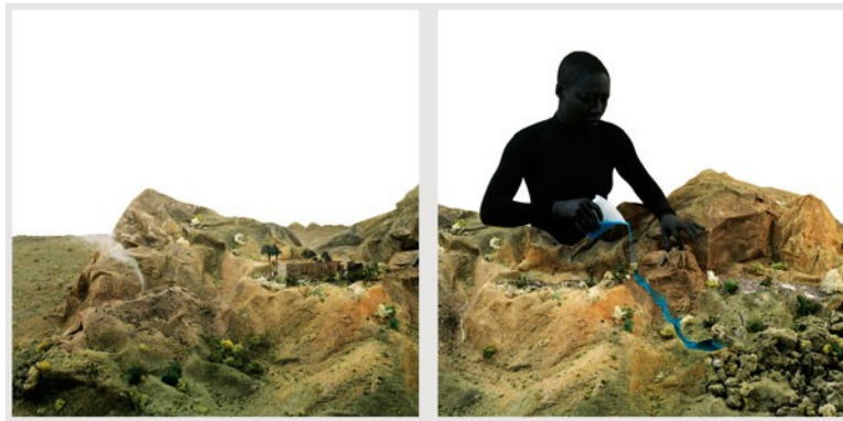
Afb. 15. Otobong Nkanga, Alterscape Stories; Spilling Waste , 2006.

Voor de van oorsprong Nigeriaanse kunstenaar Nkanga Otobong (1974), die nu in België woont, is ecologie een belangrijk onderwerp. 33 Zij verbeeldt in haar collages, foto's en schilderijen het verpeste en vernietigde Nigeria en zij stelt in haar performances de rol van Afrikaanse vrouwen en de last die gewoontes kunnen zijn ter discussie. Ook de olievelden van Nigeria zijn onderwerp van haar kunst.