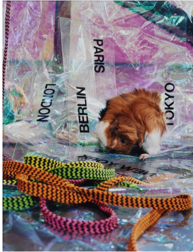
Afb. 1. Josephine Pryde, Scale XVI , 2012.