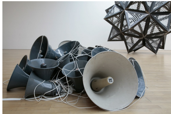
Afb. 6. Kendell Geers, Truth or Dare , 2001.

Een van de kunstenaars die ook deelnam aan de Anti-Fascisme tentoonstelling van BAK in Utrecht in 2012, was Jonas Staal (1981) een van de bekendste hedendaagse geëngageerde Nederlandse kunstenaars. 27 Hij vertaalde het model voor het gevangeniswezen dat de PVV-politica Fleur Agema in het kader van haar Masterstudie architectuur in 2004 had uitgewerkt samen met architecten om tot een boek, maquette, film en tentoonstelling. 28