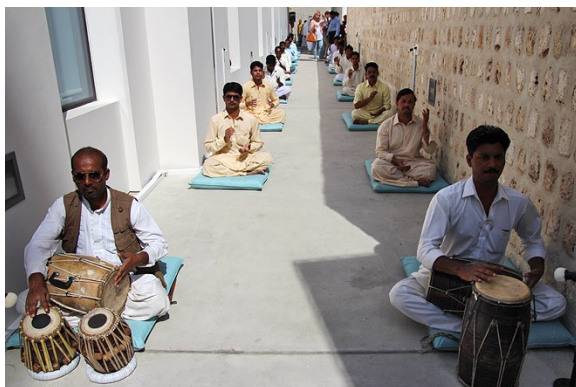
Afb. 2. Wael Shawky, Dictums 10:120 , 2013.

De Egyptische kunstenaar Wael Shawky (1971) werkt sinds een aantal jaren aan zijn Cabaret Crusades en presenteerde op monumentale wijze op de dOCUMENTA (13) in 2012 zijn video van een Arabisch poppenspel. Met zijn werk Dictums 10:120 uit 2013 levert de kunstenaar ‘een institutionele kritiek op de economie en de arbeidsmigratie’ 21 . Voor de Biënnale van Sharjah in 2013 werkte hij twee jaar samen met arbeiders die aan de materiële totstandkoming van deze Biënnale werkten. Hij wilde deze onzichtbare werkers zichtbaar maken door hun een lied te laten componeren. 22