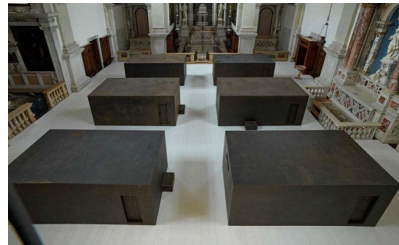
Afb. 9 en 10 Ai Wei Wei, Sacred Installation , Interieur en Exterieur, 2013.