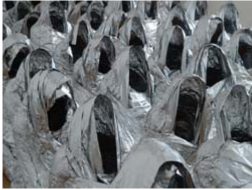
Afb. 14. Kader Attia, Ghost , 2007.