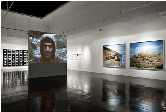
Afb. 18. Akram Zaataari, Libanon paviljoen in Venetië, 2013.

Dit laatste thema staat op naam van de Libanese filmmaker, fotograaf, archiefkunstenaar Akram Zataari (1966), in 2013 ook vertegenwoordigd op de Biënnale van Venetië. 40 Hij onderzoekt op welke wijze televisie in territoriale conflicten bemiddelt en de wijze van vervaardiging en verspreiding van beelden in de hedendaagse geografische scheiding in het Midden-Oosten. 41