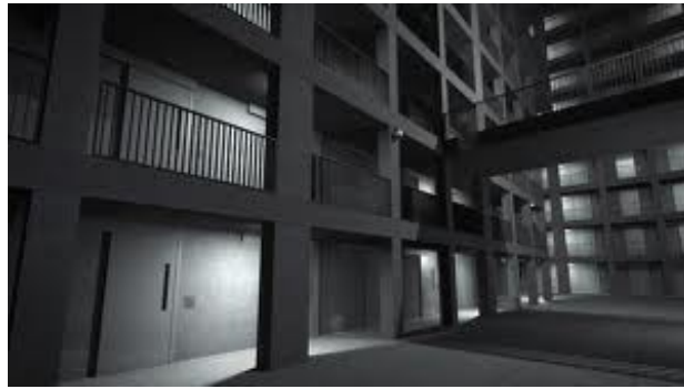
Afb. 7 en 8. Jonas Staal, Politiek Kunstbezit III , Interieur en Binnenplein, 2013.

Het is bijzonder om de sterke overeenkomst te zien van de op basis van Agema's visie gecreëerde gevangeniswereld met het kunstwerk van Ai Wei Wei (1957) in de Biënnale van Venetië, waar het totalitaire gevangenisstelsel van China in beeld werd gebracht.