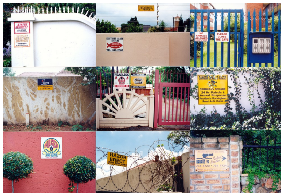
Afb. 5. Kendell Geers, Suburbia , 1999.

In deze rubriek hoort zowel niet-westerse kunst die tegen de staatsdictatuur wordt ingezet als kunst die de Big Brother aspecten van de hedendaagse westerse samenleving bekritiseert. De Zuidafrikaanse kunstenaar Kendell Geers (1968) wordt beschouwd als politiek activist en zijn kunst kan worden ingedeeld in drie categorieën; naast kritiek op de overheid, bekritiseert hij ook het neo-liberalisme en de geschiedenis van anti-apartheid van zijn geboorteland. Uit politieke overwegingen heeft hij zijn naam veranderd, heeft hij als geboortjaar (mei) 1968 gekozen en heeft Zuid-Afrika verlaten om geen dienst in het apartheidsleger te hoeven doen. Pas nadat Nelson Mandela was vrijgelaten is hij teruggekeerd naar Zuid Afrika. 25 Hij heeft deelgenomen aan de Biënnale van Istanbul van 2013 en deed op 11 juni mee aan de bezetting van het Gezi Park door onder anderen milieuactivisten, studenten en kunstenaars. Deze bezetting was voor hem het bewijs dat kunstenaars geen curatoren nodig hebben om actief te worden in het publieke domein. 26