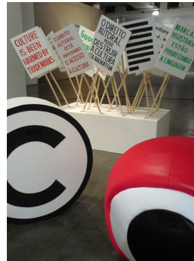
Afb. 12. Superflex, Good Copy, Bad Copy , 2006.

Een tweede voorbeeld dat in deze categorie wordt gepresenteerd is de in Frankrijk geboren kunstenaar Kader Attia (1970). Het geboorteland van zijn ouders was Algerije en Attia leeft nu afwisselend in Algiers en Berlijn. In zijn werk Open Your Eyes uit 2010, dat te zien was op de dOCUMENTA (13) in Kassel in 2012, verbindt hij het Europese trauma van de tweede wereldoorlog met het Afrikaanse trauma van het kolonialisme. Het groteske, zo laat hij zien, is niet voorbehouden aan wat men in het westen 'het primitieve' noemt. 31