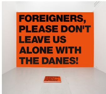
Afb. 11. Superflex, Foreigners, please don't leave us alone with the Danes! , 2002.

gewelddadig optreden en de inzet van allerlei vergaande controlesystemen. 30