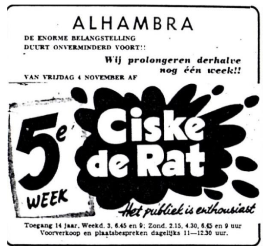
Figuur 4 advertentie Alhambra 3 november 1955. 47

Met de komst van het City Theater waren er in 1955 weer drie bioscopen in Enschede, net als in het begin van de jaren vijftig. In de tussentijd werd er door de bioscoopexploitanten genoeg geïnvesteerd in technologische innovatie. De komst van de televisie in de jaren vijftig zorgde ervoor dat Amerikaanse filmproducenten gingen investeren in het verbeteren van de beeld- en kleurkwaliteit van de films, aldus Bordwell en Thompson. 52 Op deze manier zou de aantrekkingskracht van de bioscopen en de films worden vergroot. Cinemascope was een technologie die de bezoekers naar de bioscopen zou halen. Het was een van de meest populaire breedbeeldsystemen, waardoor de bioscoopexploitanten moesten investeren in bredere doeken en geschikte lenzen voor de projectoren. 53 Uit de filmadvertenties blijkt dat het City Theater, net als het Alhambra Theater en Cinema Palace, films kon vertonen in Cinemascope. Daarnaast bleven de drie bioscopen films vertonen in Technicolor, waarbij de Firma Koper in de advertenties de technologische mogelijkheden zo veel