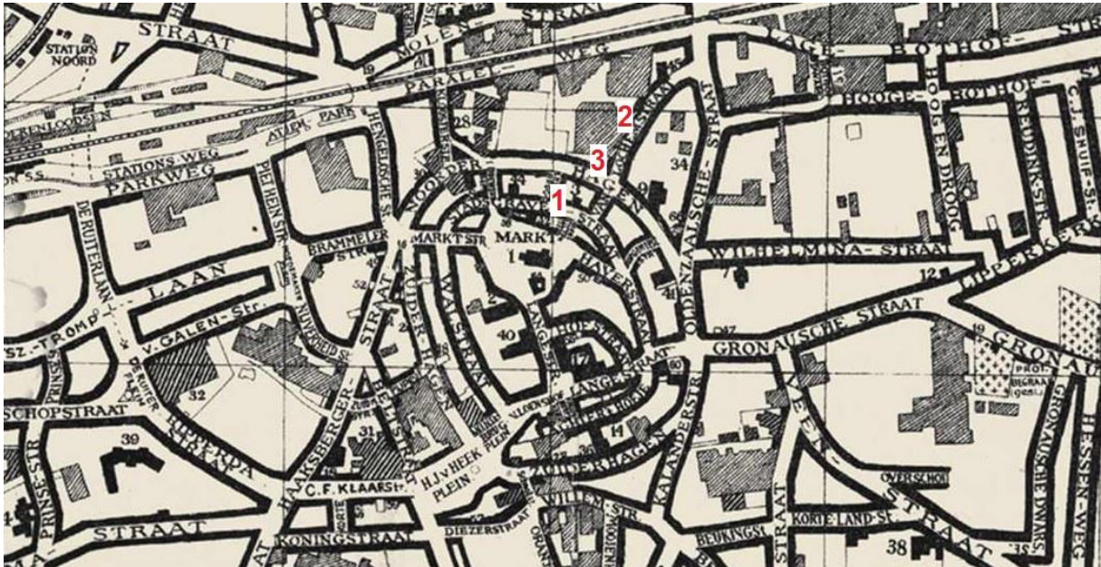
Figuur 1 Plattegrond Enschede. 20 Plaatsing bioscopen in 1950. 1: Alhambra Theater. 2: Cinema Palace. 3: Bioscoop Irene

Enschede, de grootste stad in het oosten, stond in de jaren vijftig bekend om zijn textielindustrie. Net als in de rest van het land zette ook in Enschede de groei van het aantal bioscopen door tot eind jaren vijftig. 17 Aan het einde van dit decennium had de bioscoopsector zijn grootste omvang bereikt, de meeste steden hadden op dat moment een eigen filmtheater. 18 In 1950 waren er drie bioscopen gevestigd in Enschede: Het Alhambra Theater en Cinema Palace van de Firma Serlie, en Bioscoop Irene, geëxploiteerd door de Firma Koper(zie figuur 1). 19