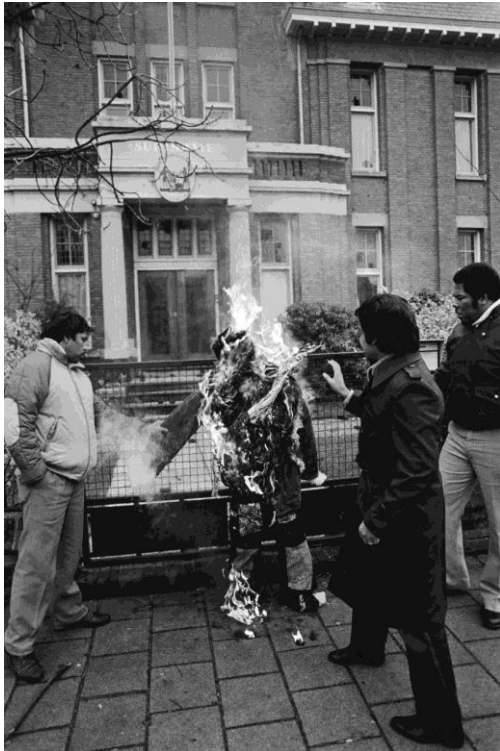
Demonstratie na de Decembermoorden in Suriname voor de Surinaamse Ambassade in Den Haag, 12 december 1982 57

Het is niet bekend wat het aandeel van Surinaamse studenten in de genoemde organisaties was. Informatie over het protest van 12 december 1982 is al helemaal dun gezaaid. Een jaar later vond er een hongerstaking plaats op het Binnenhof. Hiervan bestaan zeker twee foto's waarop studenten staan. 58 Uit de onderschriften valt af te leiden dat het een protest betrof tegen het regime van Bouterse en ter herinnering aan de Decembermoorden van een jaar eerder. Het ging hier dus om een actie tegen het militaire regime van Bouterse. De organisatie hiervan lag in handen van enkele (studenten)organisaties afkomstig uit Nijmegen en Den Haag; hierop wordt in hoofdstuk 3 dieper ingegaan. Het is niet duidelijk of er hierna meer van dergelijke acties hebben plaatsgevonden; mocht dat het geval zijn geweest, dan heeft de Nederlandse media daar geen aandacht geschonken. Het activisme in het contra-Bouterse kamp van de Surinaamse gemeenschap in Nederland kan dus getypeerd worden als kortstondig en onsamenhangend. De politieke betrokkenheid van studenten in Nederland bleef na de politieke verwickelingen in Suriname betrekkelijk vrijblijvend. Het is waarschijnlijk maar een zeer kleine groep studenten geweest die in hongerstaking is gegaan op het Binnenhof; de overgrote meerderheid van de studenten hield het daarom vermoedelijk bij