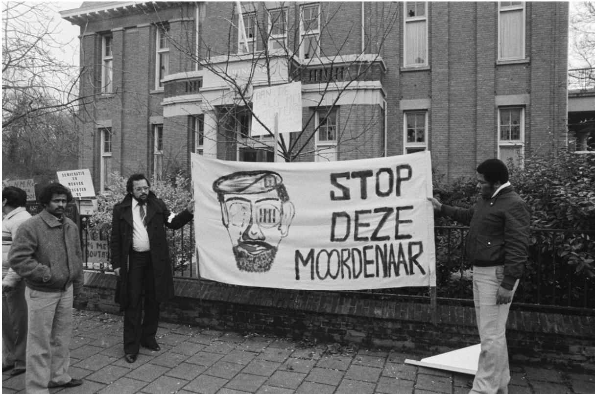
Demonstratie na de Decembermoorden in Suriname voor de Surinaamse ambassade in Den Haag, 12 december 1982 1

De reacties van Surinaamse studenten in Nederland op de politieke ontwikkelingen in Suriname in de periode 1980 – 1986