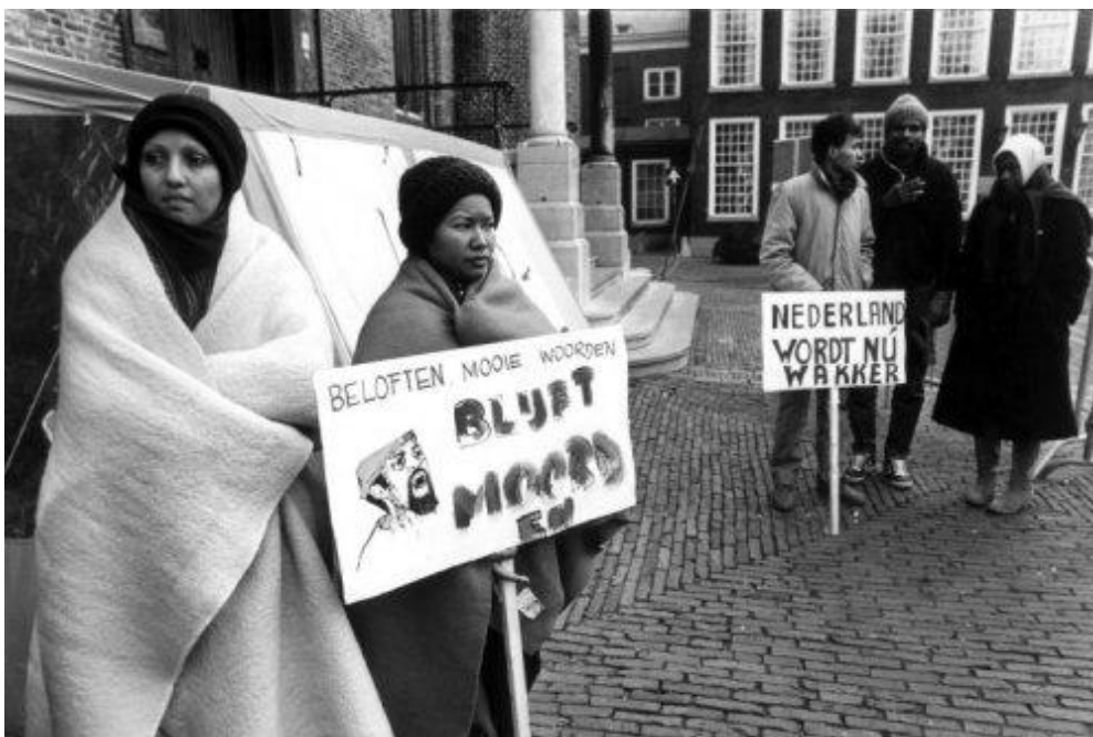
Surinaamse studenten in ballingschap in hongerstaking tegen bewind Bouterse op het Binnenhof, 2 december 1983 59

discussiëren in eigen kring over de gebeurtenissen. Interessant is wel de locatie die de hongerstakers voor hun actie kozen: in tegenstelling tot de demonstratie van 12 december 1982 die vanuit de vakbonden werd geleid en gehouden werd voor de Surinaamse ambassade, bivakkeerden de studenten op het Binnenhof. Het is daarom aannemelijk dat de hongerstaking bedoeld was niet alleen als protest tegen het regime in Suriname, maar ook tegen de houding van Nederland in de kwestie. Het bord met 'Nederland wordt nu wakker' bevestigt dat idee. Net als het eerder beschreven protest van de Haïtiaanse gemeenschap in New York richtte de Surinaamse studenten in het contra-Bouterse kamp hun protestpijlen dus op zowel het thuisland als het land van vestiging.