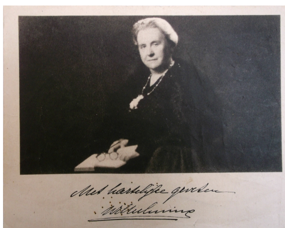
Afbeelding 9: Foto van koningin Wilhelmina met op de achterkant de tekst: 'Dit nieuwe portret van H.M. de Koningin is speciaal genomen om door de R.A.F. te worden verspreid namens de uitgevers van De Wervelwind'.