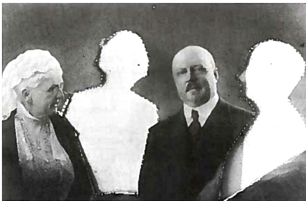
Afbeelding 8: Een portret waarbij alleen de afbeeldingen van koningin Wilhelmina en prinses Juliana zijn weggehaald.

De Duitsers wilden de Oranjes uit het openbare leven verbannen. Portretten van de koninklijke familie werden, in de loop van 1941, uit openbare gebouwen gehaald. Dit