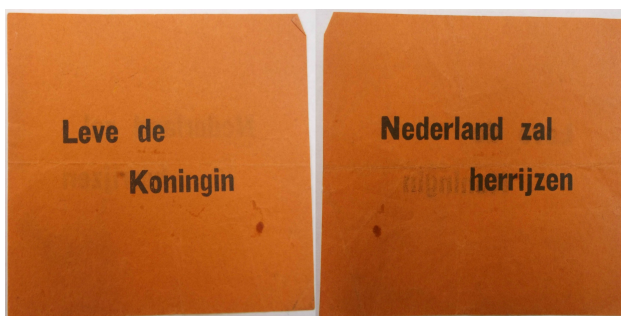
Afbeelding 2: Oranje papiertje met de leuzen 'Leve de Koningin' en 'Nederland zal herrijzen'.

Door het gebruik van symbolen lieten de Nederlanders zien dat zij Oranje terug