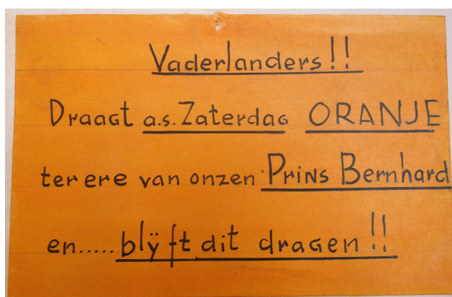
Afbeelding 3: Oproep uit 1940 om de verjaardag van prins Bernhard te vieren.

Het bekendste voorbeeld van Oranje-verzet waren de vieringen van de verjaardagen van de koninklijke familie. De eerste verjaardag tijdens de bezetting was die van prins Bernhard op 29 juni 1940. Standbeelden van de Oranjes werden versierd met bloemen, draaiorgels speelde het Wilhelmus, mensen droegen oranje kledingstukken waarop oranje bloemen maar vooral witte Anjers werden gestoken. De witte Anjer was de favoriete bloem van prins Bernhard en hij droeg deze ook