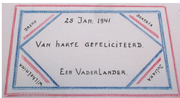
Afbeelding 6: Felicitatiekaart versierd met de kleuren van de vlag.

Van de ansichtkaarten die verstuurd zijn hebben de meesten een bloem of soms een ooievaar op de voorkant. Slechts een enkele kaart heeft een Oranje uiterlijk. Deze zijn meestal zelf in elkaar geknutseld en niet ondertekend. Wellicht voelden de mensen toch enige schroom om hun naam en adres op deze provocerende kaarten te schrijven. Ook andere kaarten, zonder enige