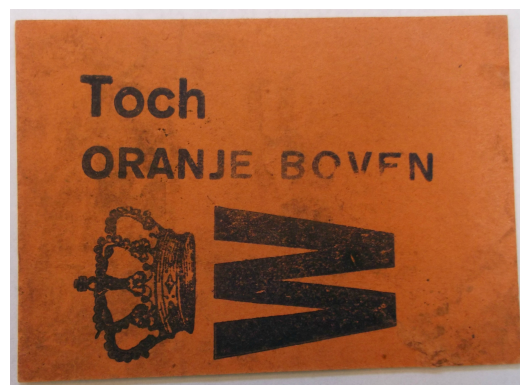
Afbeelding 1: Oranje briefje verspreid tijdens de oorlog om de trouw aan Oranje te tonen.

Na de eerste woede en teleurstelling werd het gezag vanuit Londen echter al vrij snel geaccepteerd. De reputatie van het koningshuis herstelde zich snel en groeide in prestige. De woede om de vlucht werd