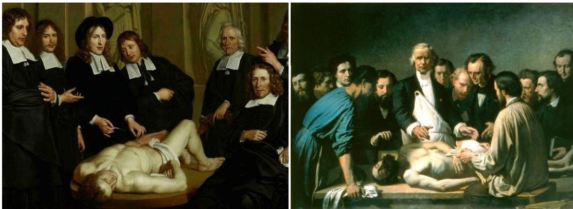
Afb. 6. De Aanatomische les van prof. Frederik Ruysch door Adriaen Backer, 1670.

de afbeeldingen beneden kijken de aanwezige chirurgijns met gepaste afstand en wetenschappelijke nieuwsgierigheid naar het lijk. Ter vergelijking, in Engeland zijn er geheel andere afbeeldingen in de omloop. Een voorbeeld hiervan is een van de bekendste afbeeldingen van William Hogarth die op de voorkant van deze scriptie is afgebeeld en welke is vervaardigd in 1751. De straf van de crimineel op de plaat wordt zo gruwelijk mogelijk afgebeeld. In Frankrijk zien we in het schilderij ‘La Leçon d'anatomie de Velpeau à la Charité’ weer een meer ‘Hollandse’ stijl. Vermoedelijk heeft dit te maken met de positie en het doel van ontleedkunde in beide landen. De voorplaat van deze scriptie is door een sociaal criticus gemaakt die de strafrechtelijke functie van de sectie op afschrikwekkende wijze wilde blootleggen. Het Franse en Nederlandse geval zegt misschien net iets meer over hoe de anatomisten zich willen laten afbeelden, aangezien de schilderijen in opdracht van henzelf zijn gegeven. Door geschreven en fysieke bronnen weten we welke status anatomie in Groot-Brittannië had, maar de Hollandse schilderijen geven helaas geen beeld van de status van de ontleedkunde voor de gewone man.