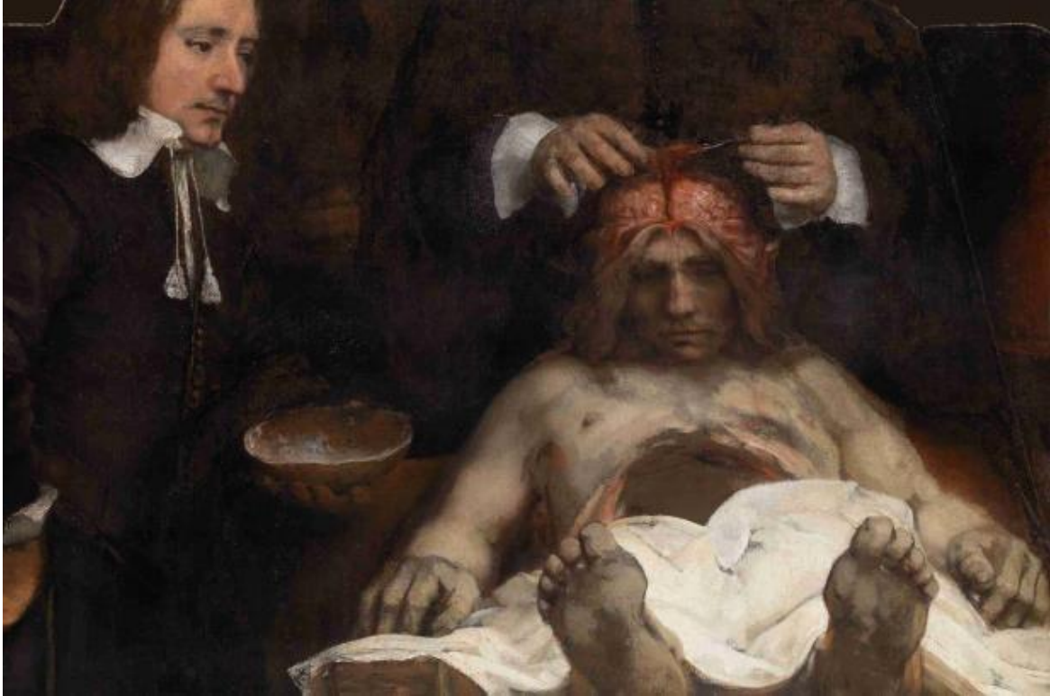
Afb. 5. Joris Fonteijns hersenen worden door Dr. Deyman blootgelegd. Schilderij van Rembrandt in 1656. 39