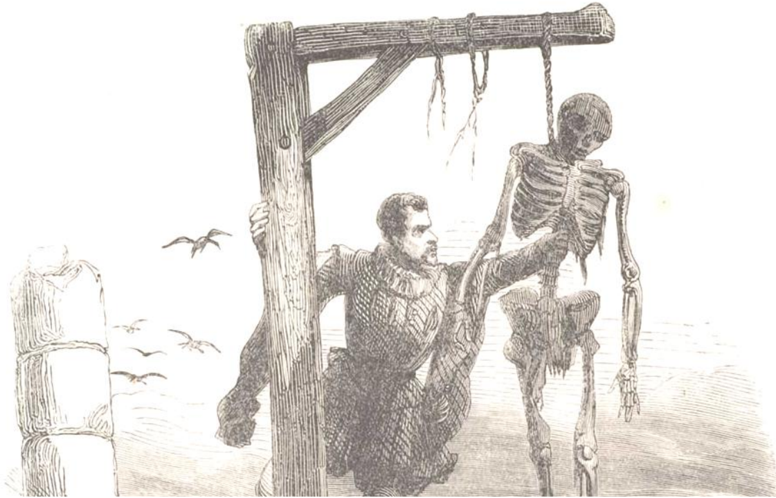
Afb. 2. Vesalius steelt een lijk van de galg. 5