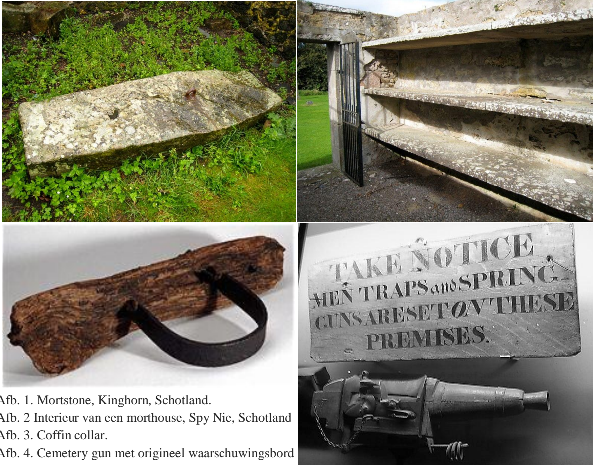
Afb. 1. Mortstone, Kinghorn, Schotland.

achttiende eeuw en was erg populair in de loop van deze eeuw, waarna het midden jaren 1820 in Engeland verboden werd. In de Verenigde Staten zijn deze wapens langer in gebruik gebleven, omdat lijkenroof hier later, tussen 1865 en 1890, haar hoogtepunt bereikte. Van deze periode zijn ook bronnen bekend over andere gepatenteerde uitvindingen die hoofd moesten bieden aan de problemen. Zo zijn er verschillende modellen grafortpedo's van Amerikaanse makelij op de markt gebracht.