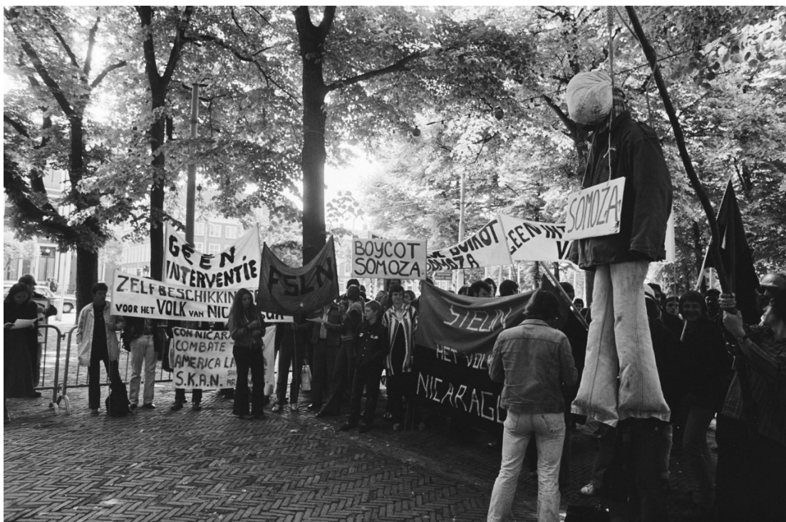
Afbeelding: Nationaal Archief - Fotocollectie, Rob Croes, 'Demonstratie van het Nicaragua Comité voor de Amerikaanse ambassade' (18 juni 1979), http://www.gahetna.nl/collectie/afbeeldingen/fotocollectie/zoeken/start/99/weergave/detail/tstart/0/q/zoekterm/amerikaans-e%20ambassade (bekeken op 31 augustus 2013).

In de periode 1979-1983 was het echter met name de Amerikaanse bemoeienis met landen in Zuid-en Midden-Amerika die, net zoals de Vietnambetogingen, veel demonstranten op de been bracht. In 1979 begon het verhaal de ronde te doen dat de Amerikaanse regering zich boog over een mogelijke interventie in Nicaragua. In het Midden-Amerikaanse land had een socialistische guerrillabeweging, de Sardinisten , korte metten gemaakt met het dictatoriale bewind van Anastasio Somoza Garcia. Dit was een ontwikkeling waar de Amerikanen niet blij mee waren, uit angst voor verspreiding van het communisme over het continent. De Verenigde Staten werden verdacht van het leveren van steun aan de contra's , een groep die de machtsovername van de Sardinisten ongedaan probeerde te maken.