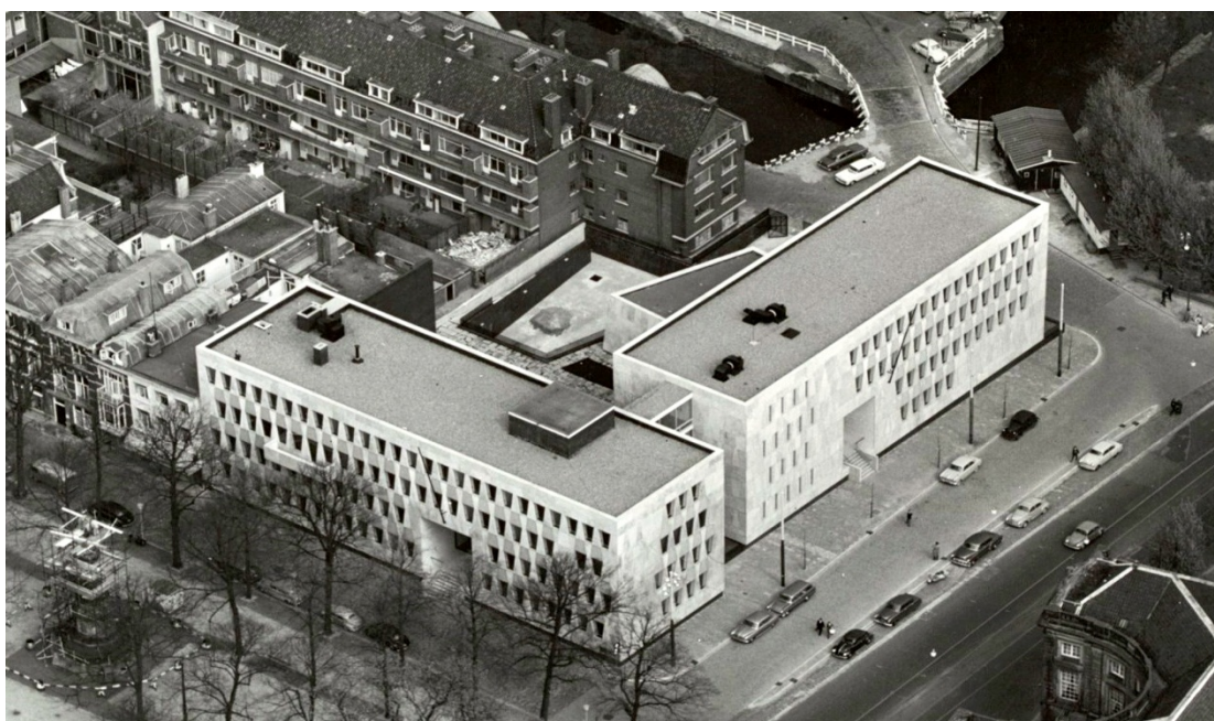
Afbeelding: Nationaal Archief - Fotocollectie, KLM Aerocarto, 'Luchtfoto Amerikaanse ambassade' (14 april 1959), http://www.gahetna.nl/collectie/afbeeldingen/fotocollectie/zoeken/start/98/weergave/detail/tstart/0/q/zoekterm/amerikaanse%20ambassade (bekeken op 1 september 2013).