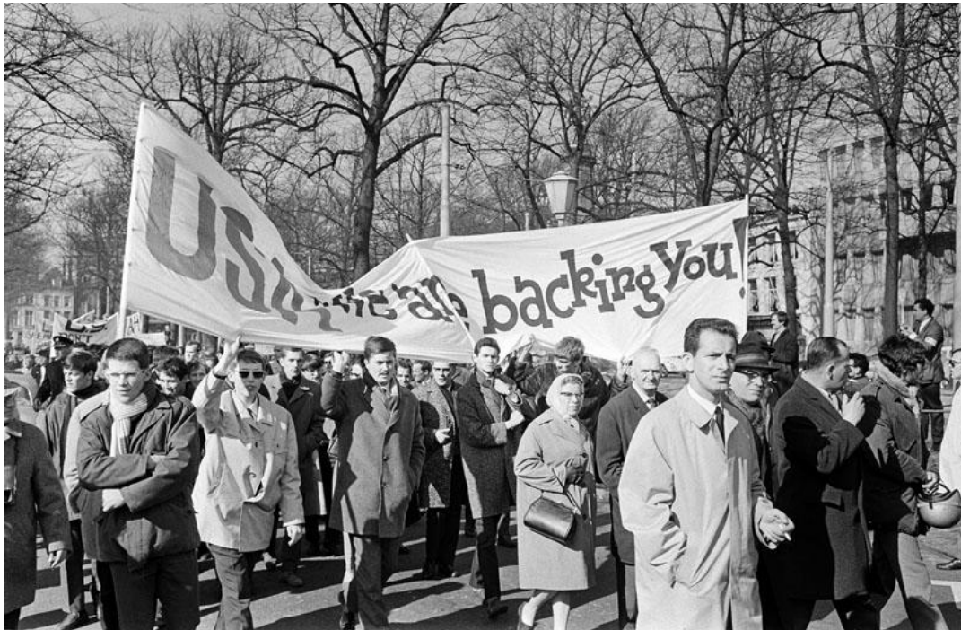
Afbeelding: Koninklijke Bibliotheek, Dick Coersen, 'Den Haag Pro-Amerika demonstratie' (17 maart 1968), http://www.geheugenvannederland.nl/?/nl/items/ANP01:13854450/&p=1&i=19&t=65&st=den%20haag%20vietnam%20demonstratie&sc=%28cql.serverChoice%20all%20den%20%20AND%20haag%20%20AND%20vietnam%20%20AND%20demonstratie%29/&wst=den%20haag%20vietnam%20demonstratie (bekeken op 31 augustus 2013).

Ook in de daaropvolgende jaren vonden er nog grote Vietnambetogingen plaats. Vaak waren hier met name jonge mensen bij betrokken, die pleitten voor een onmiddellijke terugtrekking van Amerikaanse troepen uit Vietnam en de beëindiging van de oorlog. Zo meldde het Nieuwsblad van het Noorden dat op dinsdag 16 september 1969 duizend 'Haagse jongens en meisjes' een mars door Den Haag hielden, onder leiding van de Socialistische Jeugd uit Amsterdam. Met fakkels en rode vlaggen liepen zij van de Amerikaanse ambassade naar het Binnenhof en het Plein. 'Er werd met rotjes, rookbommen en stukken baksteen naar de politiepaarden gegooid. Van de gebouwen rond het Binnenhof werd een ruit ingegooid'. 101