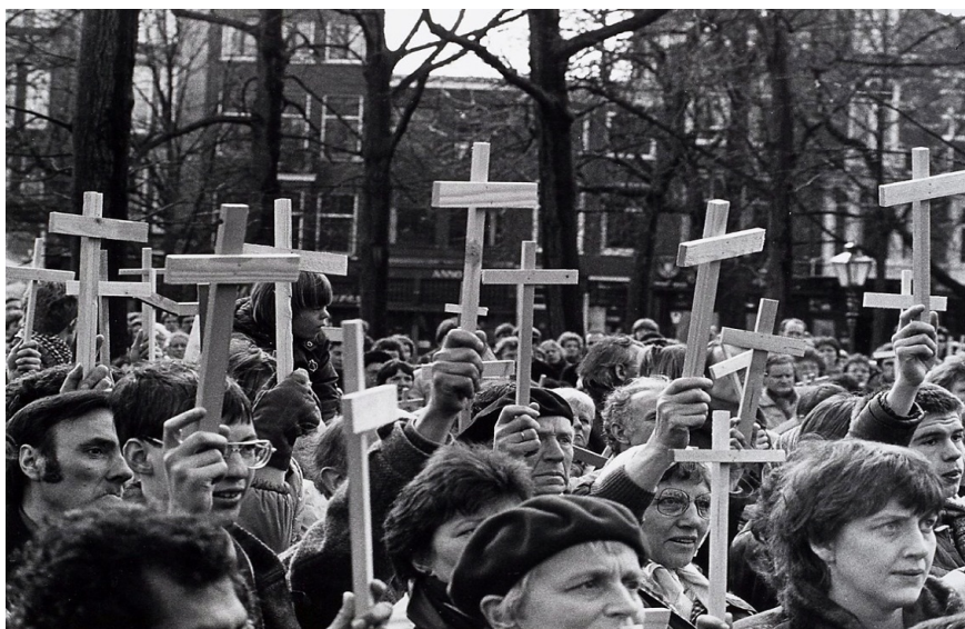
Afbeelding: Koninklijke Bibliotheek, Oscar van Alphen, '24-uurs wake bij de Amerikaanse ambassade'(26 maart 1983), http://www.geheugenvannederland.nl/?/nl/items/RIJK02:341649/&p=1&i=3&t=44&st=amerikaanse%20ambassade&sc=%28cql.serverChoice%20all%20amerikaanse%20%20AND%20ambassade%29/&wst=amerikaanse%20ambassade (bekeken op 31 augustus 2013).

Nog geen maand later, op 24 april 1983, werd er weer een demonstratie voor de Amerikaanse ambassade gehouden, ditmaal uit protest tegen de Amerikaanse politiek in Nicaragua. Deze demonstratie verliep vrij onrustig, helemaal nadat de Amerikaanse ambassade zou hebben geweigerd een petitie in ontvangst te nemen.