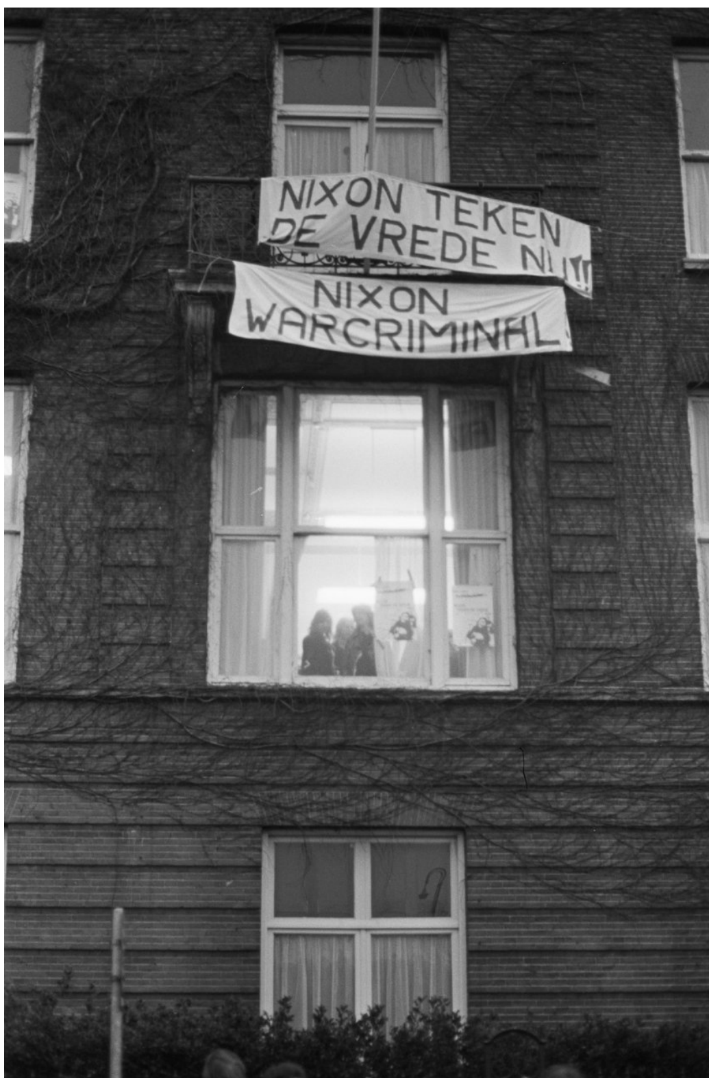
Afbeelding: Nationaal Archief - Fotocollectie, Rob Croes, 'Amerikaanse consulaat bezet' (15 januari 1973), http://www.gahetna.nl/collectie/afbeeldingen/fotocollectie/zoeken/weergave/detail/start/0/tstart/0/q/zoekterm/bezetting%20amerikaanse%20consulaat (bekeken op 31 augustus 2013)