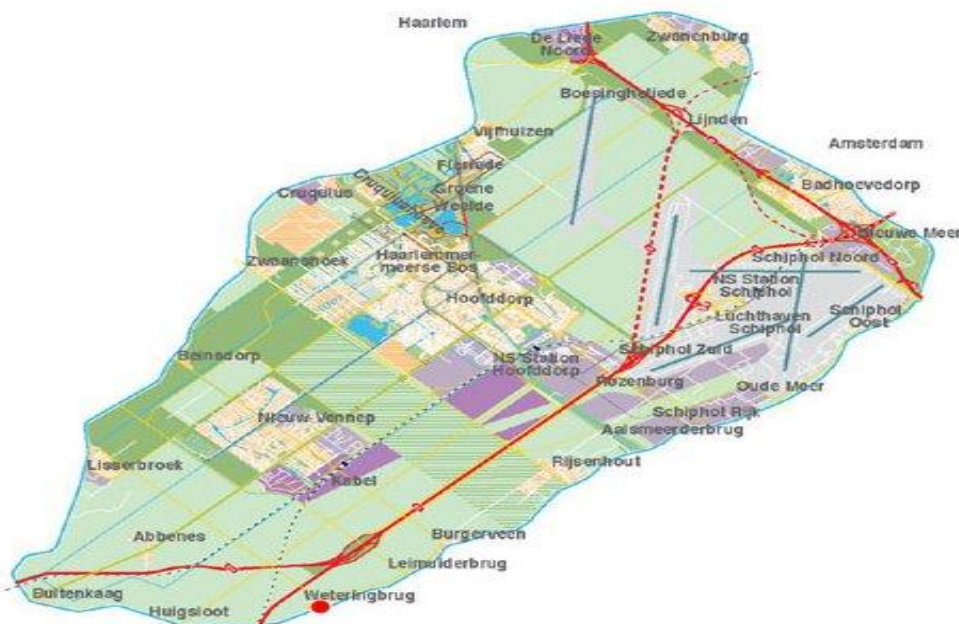
Afbeelding 1: Gemeente Haarlemmermeer

Dit onderzoek vindt plaats in de gemeente Haarlemmermeer. Dit is een gemeente in de provincie Noord-Holland. De gemeente Haarlemmermeer telt in totaal 26 dorpen met 143.962 inwoners.