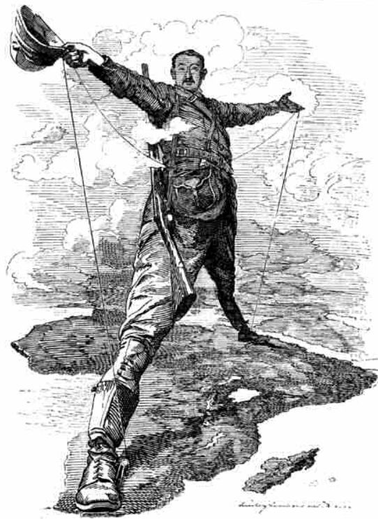
"The Rhodes Colossus" – cartoon door Edward Linley Sambourne, gepubliceerd in Punch, geeft de Engelse ambitie weer een Brits Afrika te vormen van De Kaap tot Cairo.

Salisbury was eind negentiende eeuw de voornaamste vormgever van het buitenlandse beleid van Groot-Brittannië. Bijvoorbeeld op het Congres van Berlin in 1885, waar de verdeling van Afrika afgesproken werd tussen de Europese mogendheden, waardoor een botsing van koloniale belangen voorkomen werd. Het geopolitieke strategische belang dat Groot-Brittannië had in Zuid-Afrika was het veilig stellen van de handelsroutes naar India en China via veilige havens in Zuid-Afrika. Daar kwam een tweede strategisch belang bij na de vondst van goud. in het waarborgen van een stabiele aanvoer van het goud uit Transvaal naar Engeland.