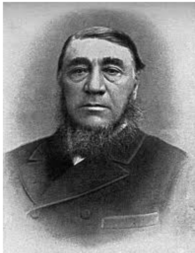
President Paul Kruger

Kruger verhoogde vervolgens de douanetarieven voor spoorvervoer via De Kaap en Natal drastisch, om de mijneigenaren zo te dwingen gebruikte maken van de nieuwe spoorverbinding met Delagoabaai. Dit leidde tot de Driftencrisis tussen september en oktober 1895. De beide koloniën probeerden de tarieven op het spoorvervoer in Transvaal te omzeilen met transport met ossenwagens voor het laatste stuk door Transvaal. Transvaal sloot als tegengzet alle doorwaadbare plaatsen in de rivier de Vaal (de driften). Het Verdrag van London bepaalde echter dat er vrij commercieel verkeer moest zijn. Engeland dreigde dan ook te interveniëren en daarvoor moest Kruger inbinden. Toch bleef Transvaal in een positie zitten die het mogelijk maakte om politieke dominantie te verwerven, omdat de koloniën aan de kust voor een belangrijk deel van hun inkomsten afhankelijk waren van de keuzes van Transvaal voor het vervoer naar de havens. 16