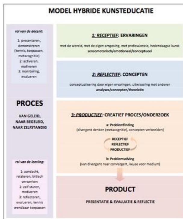
Figuur 2 Model Hybride Kunsteducatie 210

Door de hybride kunsteducatie kan men veel over kunst leren uit eigen ervaringen. Daarnaast ontwikkelt men artistieke en creatieve vermogens door het verdiepende inzicht in kunst en context en werkt men aan communicatieve en samenwerkingsvaardigheden en aan zelfbewustzijn,