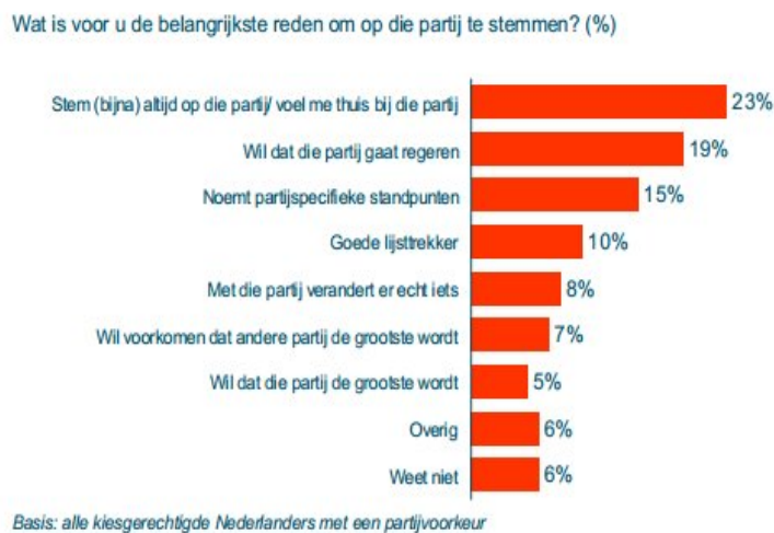
Figuur 2: De reden dat mensen stemmen volgens Politieke Barometer 2010

Lijsttrekkers proberen om mensen over te halen op hun partij te stemmen, waarbij er gebruik gemaakt wordt van campagnes. Een campagne houdt in dat, meestal de lijsttrekker van de partij, in een periode langs veel verschillende plaatsen gaat om toespraken en debatten te houden. Op deze manier probeert de lijsttrekker mensen ervan te overtuigen dat ze op de partij van de betreffende lijsttrekker zouden moeten stemmen. Op deze manier