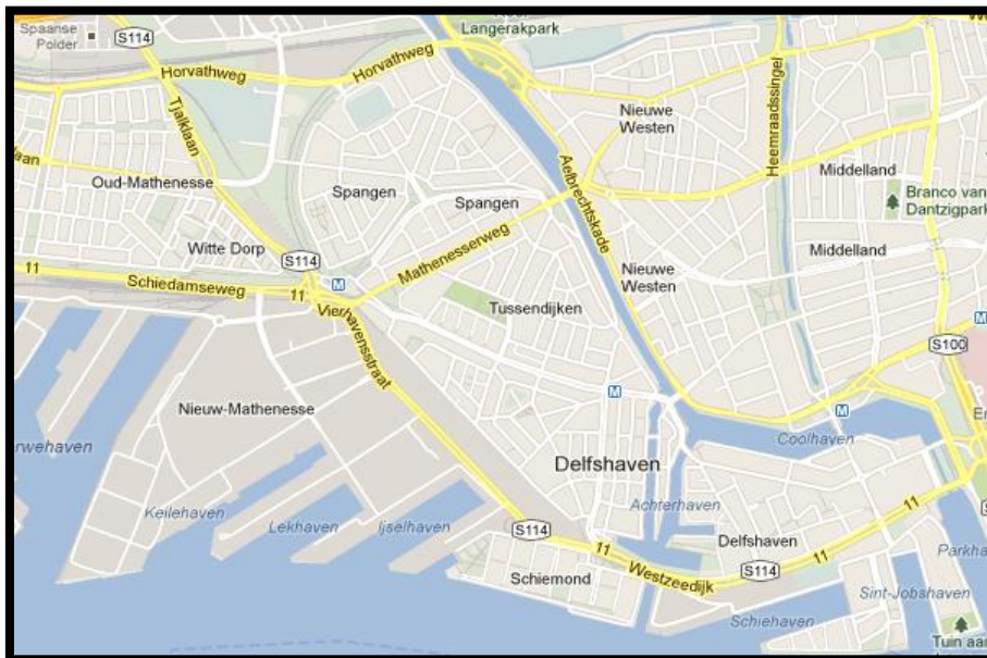
Figuur 5: Deelgemeente Delfshaven

Delfshaven is een deelgemeente van Rotterdam. Een stad die zichzelf op de markt zet als een goede plek voor welvarende bewoners en daarmee de zogeheten creatieve klasse wil aantrekken. In Rotterdam zijn al veel sociale woningen gesloopt en vervangen door koopwoningen (Uitermark & Duyvendak, 2007). De deelgemeente ligt in Rotterdam-West en bestaat uit acht wijken: Bospolder-Tussendijken, Delfshaven, Spangen, Oud-Mathenesse, Schiemond, Nieuwe Westen, Middelland en Het Witte Dorp (Figuur 5).