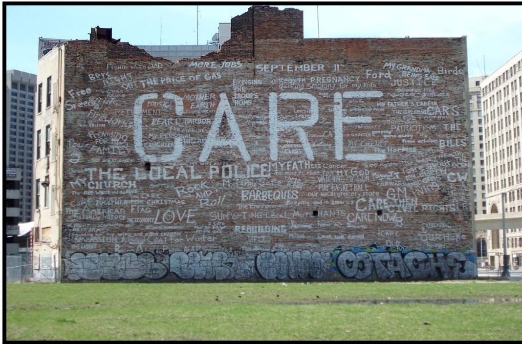
Figuur 2: Muurschildering in Downtown Detroit

de gemeenschap in dans en theater (figuur 2). Het kan een permanent of tijdelijk kunstwerk betreffen, met inbegrip van sociale en contextuele kunstpraktijken. Openbare kunst bevindt zich als het ware op een continuüm tussen flagshipkunst en gemeenschapskunst (Kwon, 2004; Remesar, 2005; Zebracki, 2012).