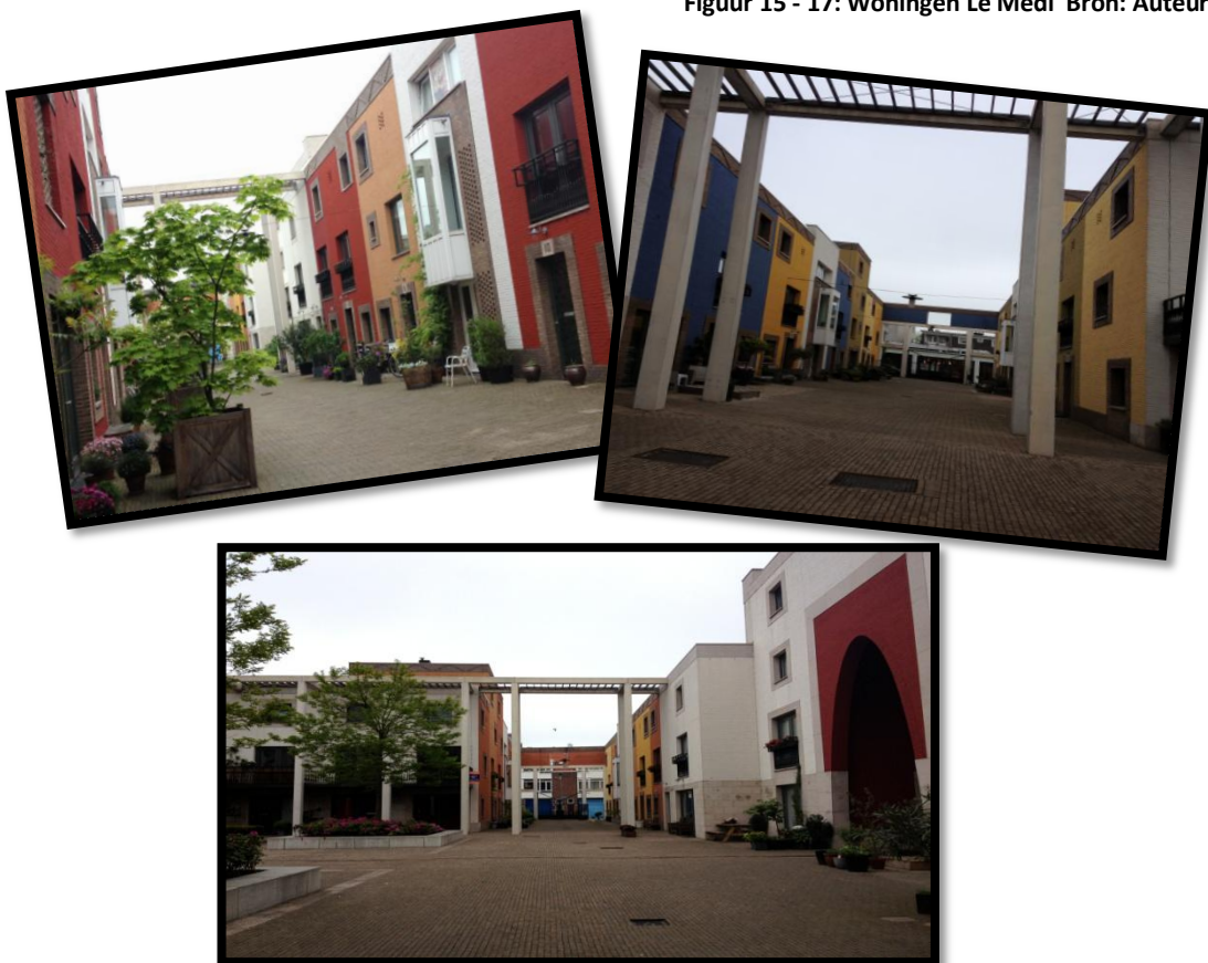
Figuur 15 - 17: Woningen Le Medi

'Gezien het idee vooruit te lopen op een trend, de hoge waardering voor symbolische consumptie en de expliciet geuite behoefte zich te onderscheiden van een leefstijl die geassocieerd wordt met lagere inkomensgroepen, lijkt deze groep respondenten sterk op de gentrifiers die Zukin (1982, 1998) beschreven heeft. Bovendien lijken ze qua levensloop en beroep veel op de 'nouvelle petite bourgeoisie' die Bourdieu (1982) beschreef' (Meier, 2009, p.295). Hierbij komt het feit dat de overgrote meerderheid in de kunst-, culturele of welzijnssector werkt of een opleiding heeft genoten in deze sectoren. De consumptie van exotisch en multiculturele wordt ook gepromoot (Meier, 2009).