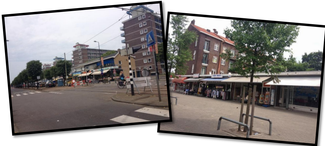
Figuur 7 & 8: Schiedamseweg, Delfshaven

getypeerd als een 'kleurrijke' winkelstraat met verscheidene winkels en horecagelegenheden. Er wordt twee keer per week een markt georganiseerd op het Grote Visserijplein (Winkeliersvereniging Schiedamseweg, 2013) (figuur 7 & 8). Er valt op cultureel gebied in de directe omgeving niet veel te beleven; uit een onderzoek van de dienst Kunst en Cultuur naar leemtes in de culturele infrastructuur blijkt dat de accommodaties van maatschappelijke voorzieningen in veel gevallen van onvoldoende kwaliteit zijn en weinig uitnodigend. De bewoners van de wijk kunnen wel profiteren van de culturele instellingen en ontwikkelingen elders in Delfshaven, bijvoorbeeld bij het Lloydkwartier en het Coolhaveneiland (Deelgemeente Delfshaven et al, 2009).