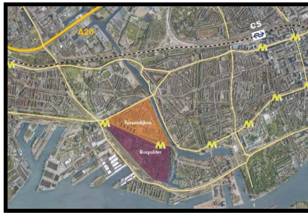
Figuur 6: Wijk Bospolder-Tussendijken

De wijk Bospolder-Tussendijken (figuur 6) ligt in de deelgemeente Delfshaven en is gebouwd tussen 1910 en 1930 (Deelgemeente Delfshaven, 2011b; Woonbron, 2013b). Er is een ontwikkelingsvisie voor de komende vijf jaar opgesteld voor deze wijk door de deelgemeente Delfshaven en woningcorporatie Com·Wonen (Deelgemeente Delfshaven, 2011b). 'Op dit moment behoort Bospolder-Tussendijken tot de sociaaleconomisch zwakste wijken van Rotterdam. Wij, deelgemeente Delfshaven, Com•wonen en Proper Stok ontwikkelaars, willen hier verandering in brengen door de huidige en toekomstige bewoners van Bospolder-Tussendijken kansen te bieden om hun sociaaleconomische positie te verbeteren en binnen de wijk een volgende stap in hun wooncarrière te zetten. Ons doel is van Bospolder-Tussendijken een wijk te maken waar mensen wonen vanuit een bewuste en positieve keuze voor de wijk' (Deelgemeente Delfshaven et al., 2009, p.5).