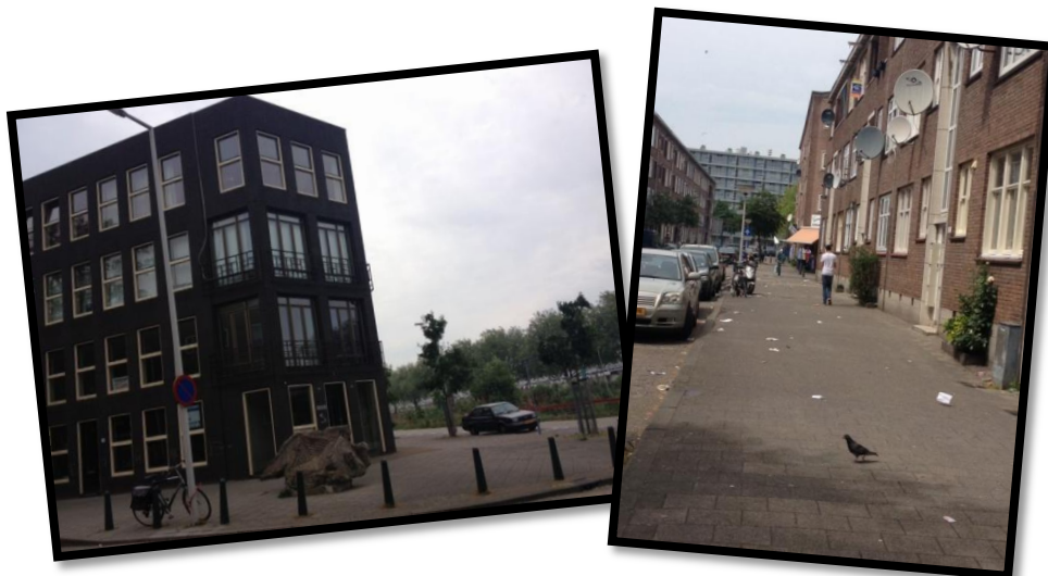
Figuur 8 & 9: Verschillende soorten huisvesting in Bospolder Tussendijken

Veel oude woningen hebben plaatsgemaakt voor nieuwbouw, met het bouwproject Le Medi als een kenmerkend voorbeeld voor de wijk (Deelgemeente Delfshaven, 2011b). De herstructurering van Bospolder Tussendijken bestaat uit de bouw van ca. 700 koopwoningen. 93 van deze woningen bevinden zich in het nieuwbouwproject Le Medi en 226 woningen in Punt 2 / Schipperstraat 2 (Top010, 2013). Er bevinden zich woningen voor iedere vraag (figuur 9 & 10); er zijn kleine en grote appartementen, eengezinswoningen, maisonnettes met dakterrassen, hofwoningen, stadswoningen, bovenwoningen en zelfs penthouses (Woonbron, 2013b).