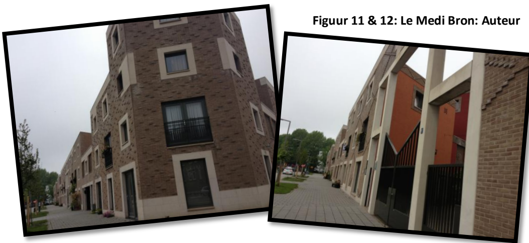
Figuur 11 & 12: Le Medi

In de wijk Bospolder-Tussendijken in de deelgemeente Delfshaven staat stadsvernieuwing centraal en wordt er tevens ingezet op de culturele diversiteit van de wijkbewoners. Het project wat hier is uitgevoerd betreft Le Medi: een multicultureel bouwproject dat is gerealiseerd na de sloop van drie bouwblokken. Dit project bestaat uit 93 grondgebonden woningen die geconcentreerd zijn in één bouwblok. Het bouwblok is in feite een mediterrane versie van een hofje, waar de ommuurde woningen 's avonds worden afgesloten door grote toegangspoorten. De verscheidene toegangen leiden naar een semi-openbaar binnengebied met een centraal plein (Van Dael, 2008; Meier, 2009) (figuur 11 - 14). Verder bestaat het project uit 18 woningen met een tuin, 1 vrijstaande woning, 4 poortwoningen en 8 woningen met terras aan het binnenplein. Ze worden getypeerd als de ideale woningen omdat ze vrij indeelbaar zijn en nog uitgebreid kunnen worden in de toekomst. Door de initiatiefnemers wordt er gepoogd om een 'oase van rust en veiligheid in de stad' te creëren (Van Dael, 2008).