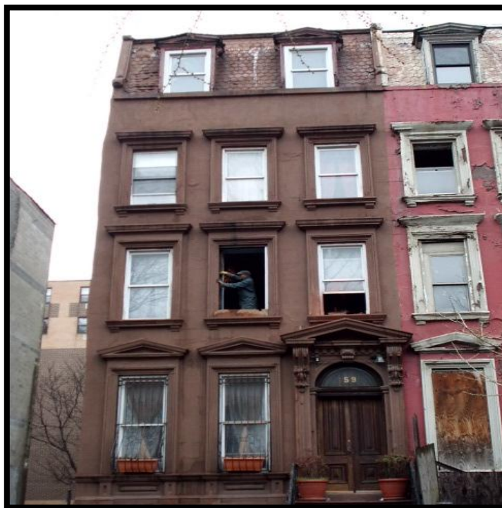
Figuur 1: Gentrification proces in Harlem, New York City