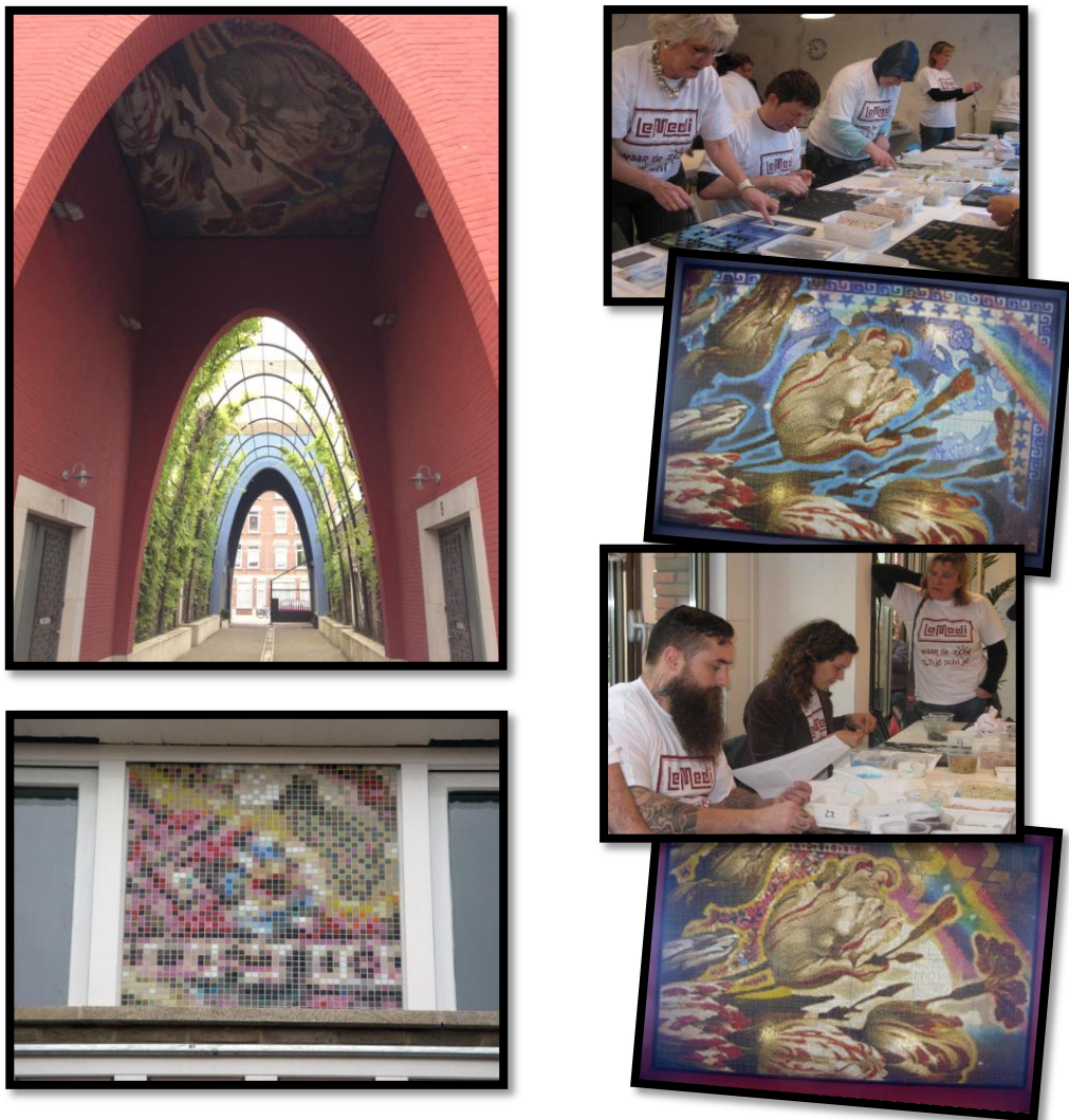
Figuur 18 - 23: Kunstproject Le Medi

Beeldend kunstenaar Arno Coenen heeft uit het kader van het project 'Groeibriljanten' mozaïeken ontworpen, met een oppervlakte van 70m 2 . Het is geïnspireerd door oud-Hollandse schilderijen en vermengd met Marokkaanse motieven. Dit tulpenontwerp moet het verleden, heden en de toekomst van de wijk verbeelden. De mozaïeken zijn in het dak van de toegangspoorten bevestigd en leggen de verbinding tussen Le Medi en de bestaande wijk Bospolder-Tussendijken (Dael, 2008). Het ontwerp is gerealiseerd in samenwerking met de bewoners, voorbijgangers, maar ook de politie, minister Vogelaar, wethouder Karakus en het personeel van ERA Bouw. In totaal hebben zeshonderd mensen meegeholpen met het mozaïeken (Van Dael, 2008; Mothership, 2008) (figuur 18-23).