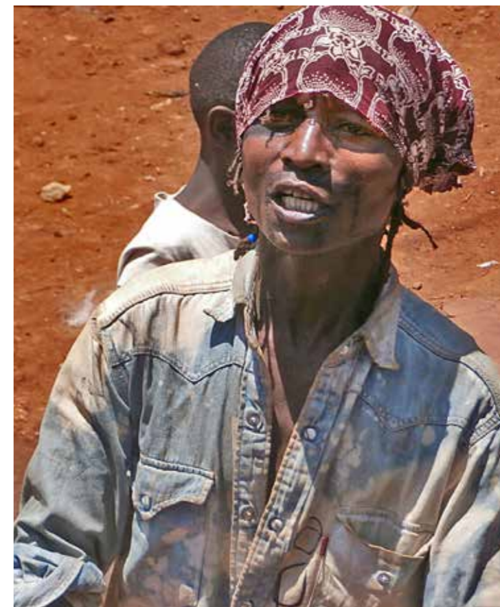
Afbeelding 2: Nyangnyang (1 maart 2013, Kibagare)

kiezen ze voor mogoka. Daarnaast kan het zo zijn dat jongeren de legale status van mogoka prefereren boven de illegale status van chang'aa.