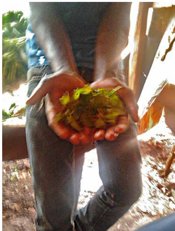
Afbeelding 1: Jongen die mogoka vasthoudt, aan zijn broek hangt een plastic zakje waar de bladeren in worden bewaard (3 april 2013, Kibagare).

is echter dat er weinig winst valt te behalen uit de verkoop zoals Violet liet weten. Een politieman wordt omgekocht voor 100KSH maar daardoor verliest men wel de dagelijkse winst. Dit is het risico van het vak, enerzijds kan er veel verdient worden aan chang'aa in vergelijking met andere banen, anderzijds kan deze winst als sneeuw voor de zon verdwijnen als de politie langs komt.