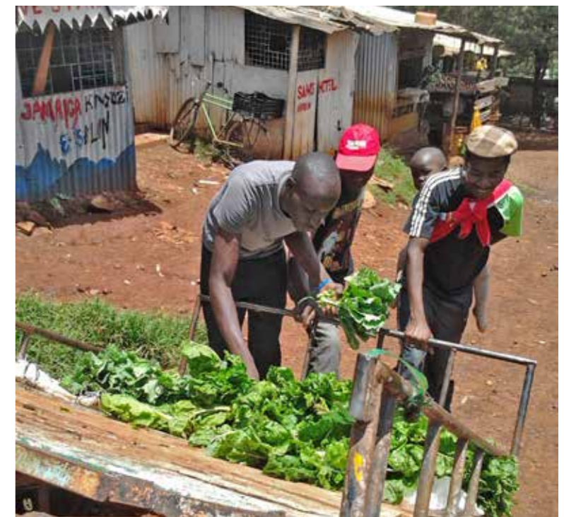
Afbeelding 3: Jeugdgroep verkoopt groenten om inkomsten te genereren en als ontsnapping aan idleness (2 april 2013, Kibagare).

“It is because of the government, they don't look after women [...] There is no work in Kenya, only jobs are available for big fish.” 28