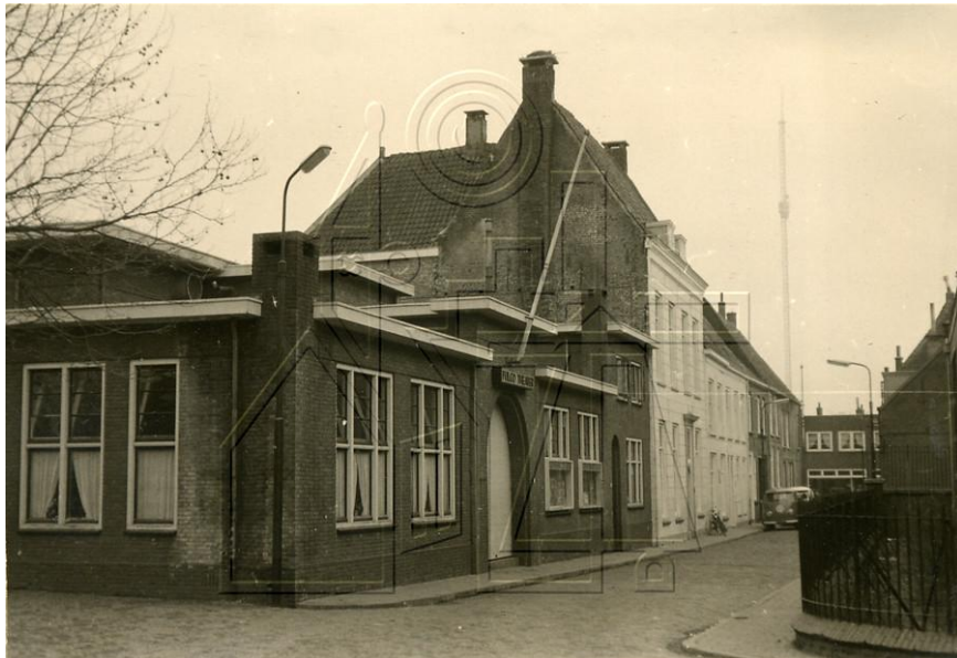
Fulcotheater rond 1960.

De bioscoop van IJsselstein en haar culturele bemiddelaars, 1948-1959