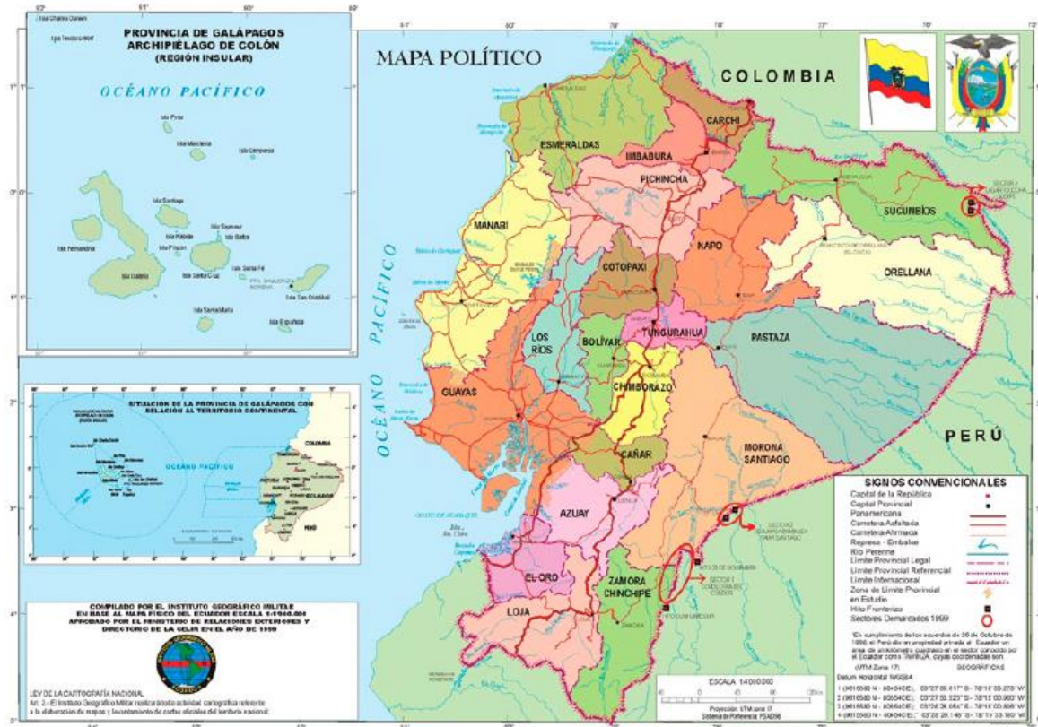
Kaart 1: Politieke verdeling van Ecuador