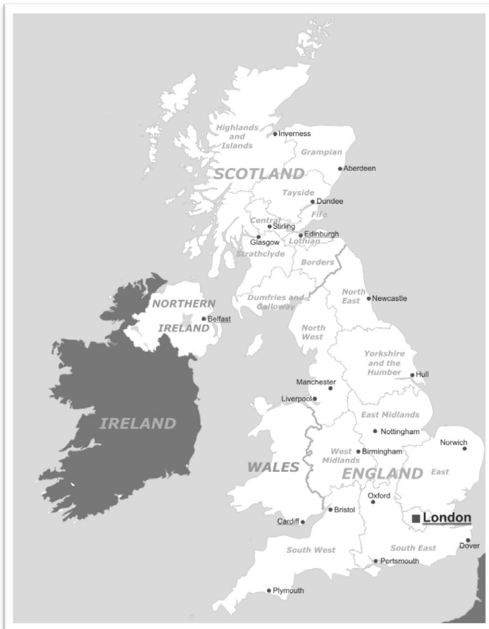
Fig. 1: De ligging van Schotland binnen het Verenigd Koninkrijk en de stad Glasgow binnen Schotland. 1