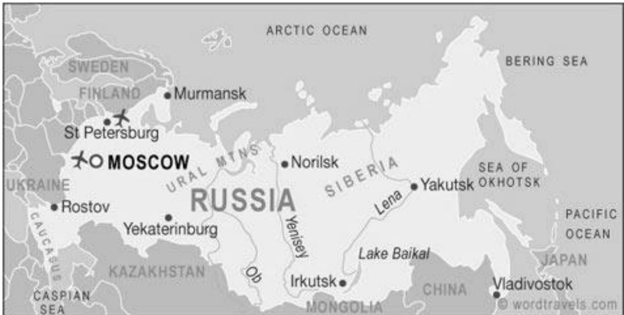
Fig. 1 Kaart van Rusland, met daarin de ligging van St.Petersburg in het Westen vlakbij de grens met Finland