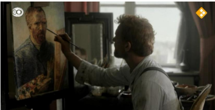
Afbeelding 6: Barry Atsma in Van Gogh; een huis voor Vincent werkend aan een zelfportret.