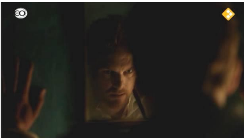
Afbeelding 5b: Barry Atsma in Van Gogh; een huis voor Vincent .