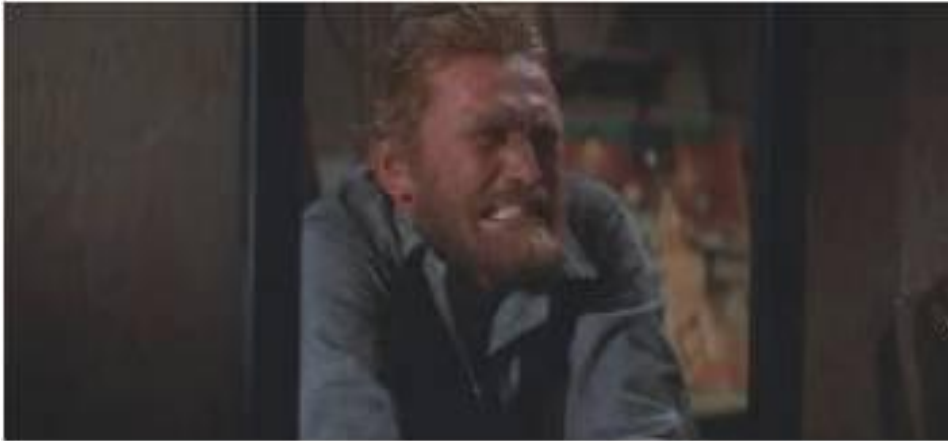
Afbeelding 5a: Kirk Douglas in Lust for Life .