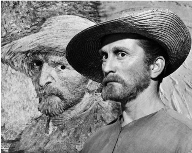
Afbeelding 2: Kirk Douglas voor een zelfportret van Vincent van Gogh.

Voor afbeelding 1 zie voorblad: Vincent van Gogh, Kraaien in het korenveld , 1890, olieverf op doek, 50.5 x 103 cm, Van Gogh museum Amsterdam.