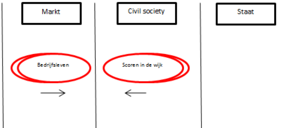
Figuur 3. Veranderende positionering bedrijfsleven en Scoren in de wijk

Deze ontwikkelingen bevestigen de theorie van Dekker (2002) die spreekt over de vervaging van de grenzen van de civil society en organisaties uit de civil society die ‘verwateren’ in andere domeinen. De krachtige conclusies van Edwards (2009) over deze overlapping tussen de institutionele domeinen civil society en markt komt overeen met de bevindingen in dit onderzoek: de civil society kan niet overleven zonder de markt en de markt heeft de civil society nodig om te groeien.