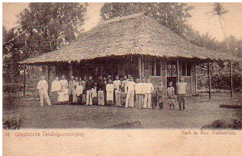
Afbeelding 5: "Kerk te Kau. Halmahera", uitgave uit ca. 1905