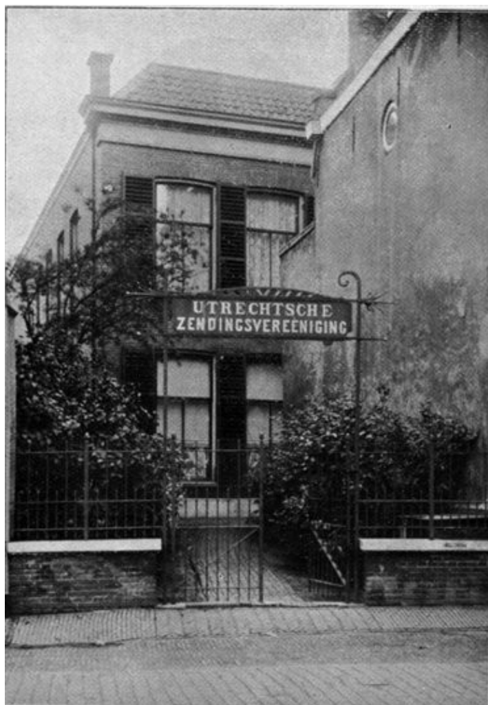
Afbeelding 1: Zendingshuis gezien van het Jansveld.