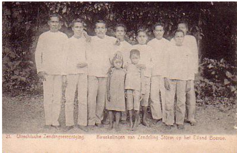
Afbeelding 4: "Kweekelingen van Zendeling Storm op het Eiland Boeroe", uitgave uit ca. 1905