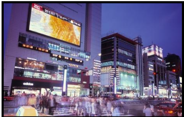
Figuur 4.

Volgens reisgidsen en reisverslagen wordt het Gangnamdistrict in Seoul, de hoofdstad van Zuid-Korea, omschreven als het meest welvarende gebied van Korea; het kan vergeleken worden met Beverly Hills. Het Gangnamdistrict alleen al, is goed voor bijna 10% van de totale waarde van het land (GDP) en dat op slechts 25 km 2 . 76 Het district wordt vormgegeven door veel grote wolkenkrabbers, zakelijke faciliteiten