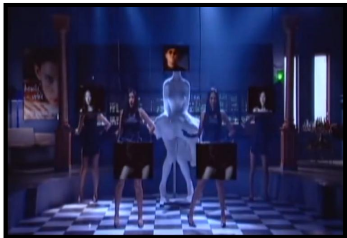
Figuur 2.