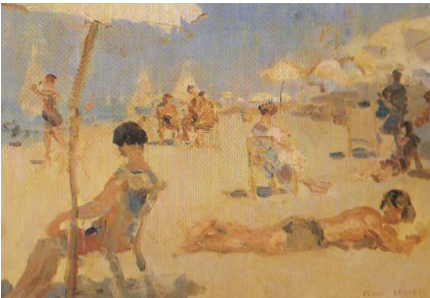
Afb. 11. Isaac Israëls, Lido, Venetië , 1925-1930, olieverf op doek, 50 x 70 cm, Frans Halsmuseum.

Vanaf 1923 tot aan zijn dood in 1934 woonde Israëls in Den Haag. Hij was zijn wilde haren in de loop der jaren een beetje kwijt geraakt en vond het dus ook niet zo erg dat er een stuk minder te zien en te beleven viel in Den Haag dan in Amsterdam. Ook in deze jaren bleef hij reizen ondernemen