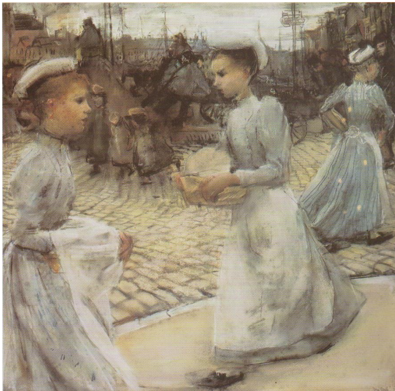
Afb. 9. Isaac Israëls, Meisjes van de Munt , ca. 1894, pastel, 530 x 530 mm, particuliere collectie.

Israëls genoot tussen 1887 en 1894 volop van de levendige sfeer die in Amsterdam heerste in de cafés, dansgelegenheden en op straat. Hij maakte ook werken waarin deze onderwerpen terugkwamen (zie afbeelding 9). Hij exposeerde echter erg weinig in deze jaren. Hier maakte vooral