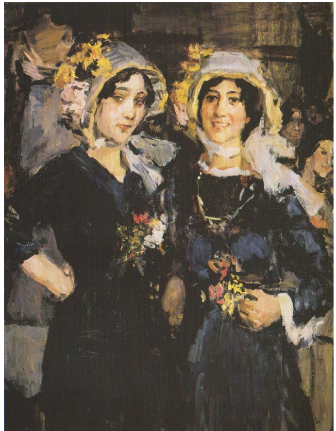
Afb. 10. Isaac Israëls, Twee vrouwen, Catherinettes , ca. 1910, olieverf op doek, 93 x 65 cm, particuliere collectie.

Isaac Israëls was een zeer reislustige man. Deze reislust had hij al vroeg meegekregen van zijn familie. Hij is zelfs van school gehaald om met zijn vader, moeder en zus een grote reis door Europa te kunnen maken. 5 Rond 1900 kwam hij in contact met het modehuis Hirsch, dat een filiaal in Amsterdam had. Van hen kreeg hij, bij hoge uitzondering, toestemming op modeshows, in de paskamers en in de naaiateliers te schetsen en tekenen. Israëls verbeeldde zowel het personeel dat aan het werk was als de klanten van het modehuis (zie afbeelding 10). 6 In 1903 kon hij in Parijs bij de courturier Paquin komen tekenen en daarvoor verhuisde hij naar de stad. Het was bijzonder dat Israëls bij deze modeontwerper mocht komen tekenen, want ontwerpers waren altijd bang dat een kunstenaar als spion fungeerde