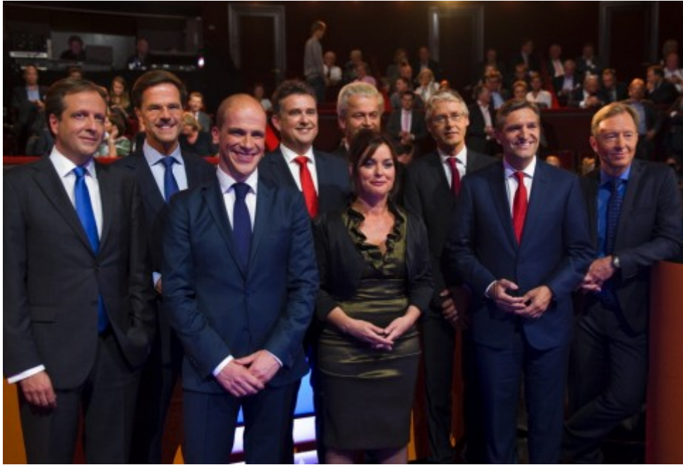
Figuur 3 - Deelnemers Pechthold, Rutte, Samsom, Roemer, Sap, Wilders, Slob, Buma.