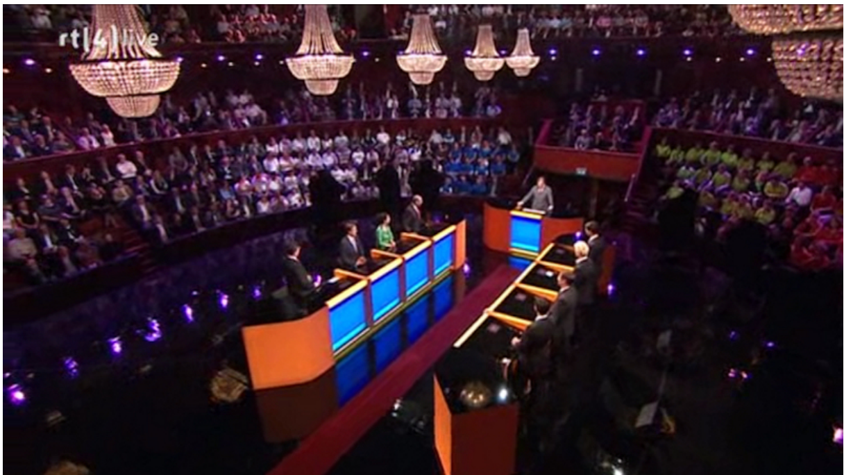
Figuur 4 - setting van het debat