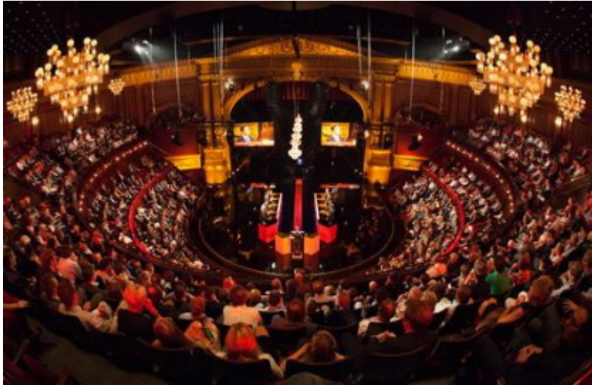
Figuur 1 - het theater