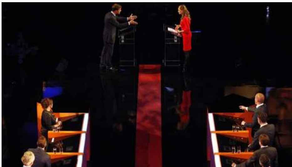
Figuur 8 - Vragenronde Grijzen & Rutte