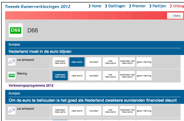
Figuur 9. Schermafbeelding 'Vergelijk uw antwoorden'

'verkiezingsprogramma 2012' geen dekkende titel is voor de verkrijgbare informatie. Ik verwacht dat gebruikers op zoek gaan naar de argumentatie van een partij, maar hier niet in