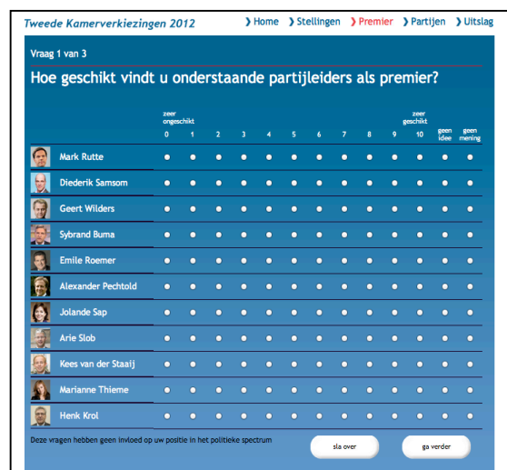
Figuur 4. Schermafbeelding van vraag over premierschap.

Wanneer de gebruiker op deze pagina aankomt, verwacht ik dat hij eerst de pagina bestudeert om te kijken wat precies gevraagd wordt. In tegenstelling tot de rustige pagina-indeling van zojuist, staat deze pagina vol met keuzemogelijkheden en moet de gebruiker even wennen aan de nieuwe opzet. Als je niet bekend bent met dit instrument, verwacht je nu de uitslag. Ik verwacht dat de gebruiker eerst de vraag voorleest en vervolgens van boven naar beneden te werk gaat. Er staat geen beschrijving bij de persoon dus wordt beoordeeld op foto en naam. Ik vermoed dat niet alle gebruikers kennen. Ik denk dat de wat onbekendere partijleiders Arie Slob, Kees van der Staaij en Henk Krol vaak beoordeeld worden met ‘geen mening’ of ‘geen idee’. Daar deze beoordeling geen invloed heeft op de uitslag, denk ik niet dat hier inhoudelijke