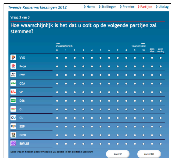
Figuur 5. Schermafbeelding van vraag over partijen.