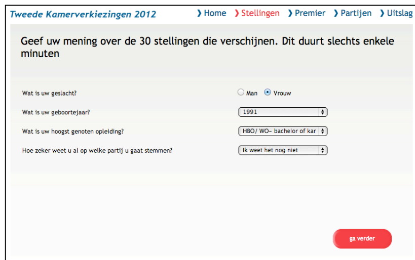
Figuur 2. Schermafbeelding van gegevens invoeren.

Er wordt boven in beeld een stappenplan gegeven, waarin de gebruiker kan zien waar hij zich in het instrument begeeft. In dit scherm wordt de uitleg gegeven voor 'Stellingen'. Het is nog onduidelijk wat 'premier' en 'partijen' inhoudt, alvorens de gebruiker bij de uitslag komt.