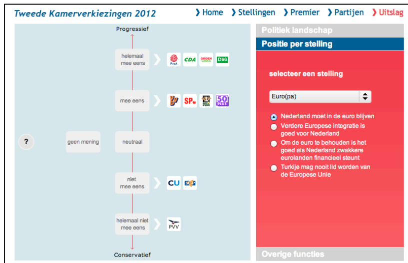
Figuur 8. Schermafbeelding van 'Positie per stelling'.

Er zijn twee manieren mogelijk om bij deze pop-up te komen (figuur 9). De eerste manier is vanuit het assenstelsel. In de instructie wordt uitgelegd dat wanneer de gebruiker op de partij