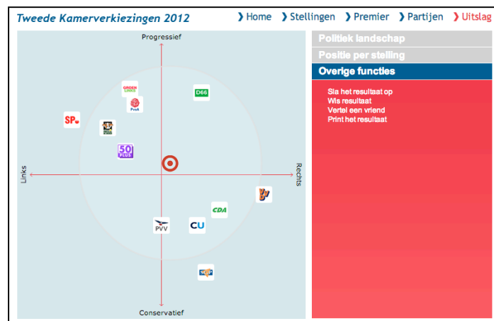
Figuur 10. Schermafbeelding van ‘Overige functies’.

Ik verwacht niet dat hier problemen ontstaan, omdat deze functies erg vanzelfsprekend zijn en niet bijdragen aan de specifieke doelstellingen van Kieskompas. Daarnaast verwacht ik niet dat hier veel gebruik van gemaakt zal worden: over het algemeen zijn mensen niet snel geneigd om hun stemgedrag uit te dragen naar derden.