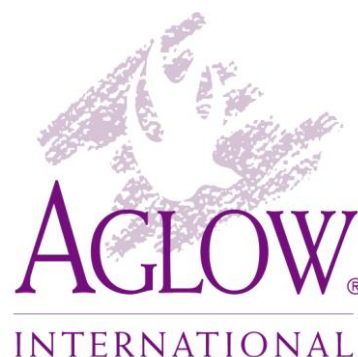
Logo Aglow International 50

Aglow is in 1967 opgericht in Amerika en in de jaren zeventig overgewaaid naar Nederland. In mijn onderzoek hanteer ik oorspronkelijk Amerikaanse wetenschappelijke literatuur en laat deze als het ware ook overwaaien naar Nederland, door (net als Griffith) Aglow te benaderen voor mijn onderzoek naar conservatiefchristelijke genderopvattingen en vervolgens het materiaal dat ik daarbij verzamel terug te koppelen naar de literatuur.