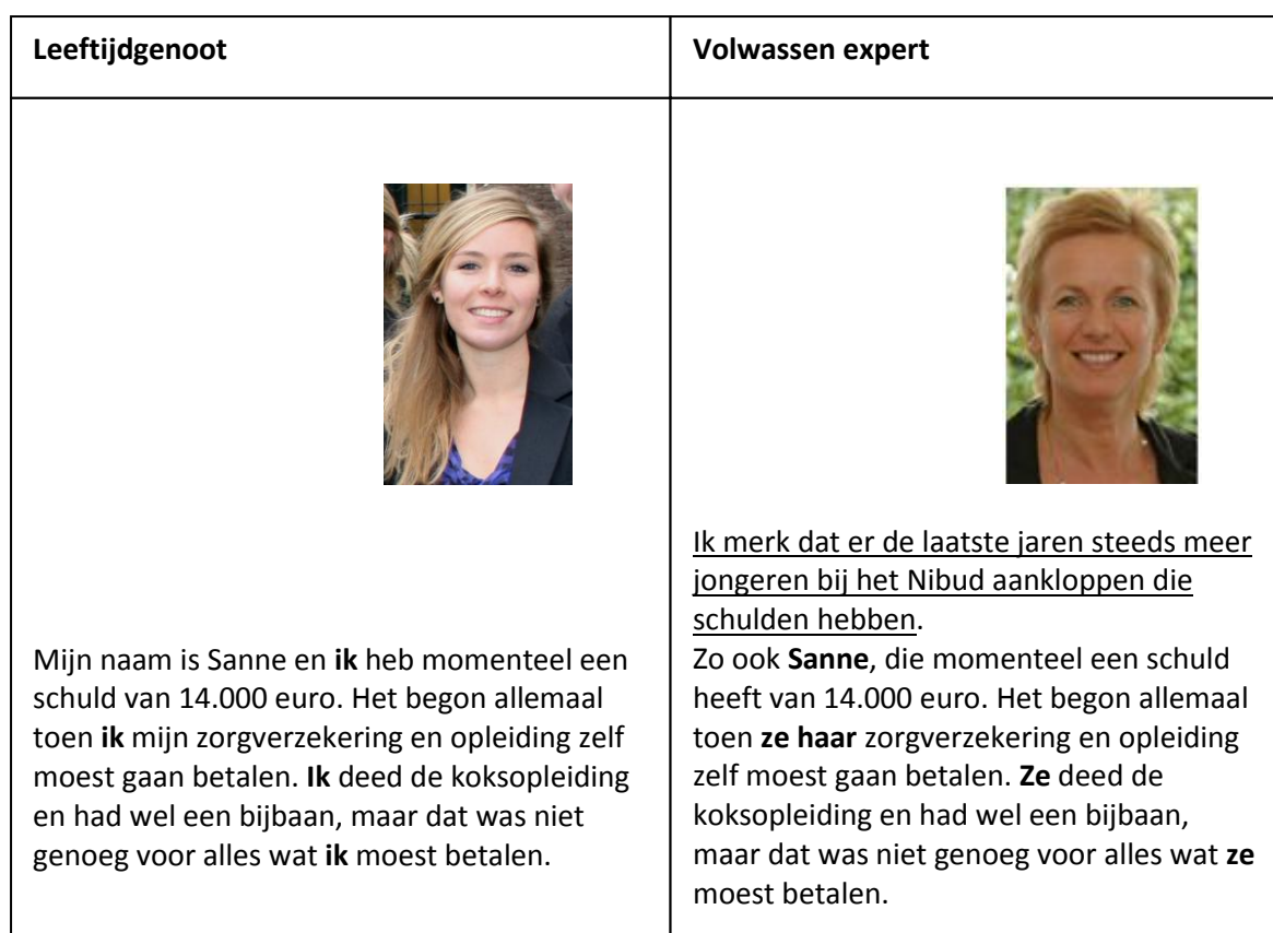
Tabel 2: Voorbeeld bronmanipulaties eerste en derde persoonsvorm, toevoeging tussenzin en foto's van bronnen.

De variatie in bron is op verschillende manieren duidelijk gemaakt. Zo heeft de leeftijdgenoot zelf een schuldverleden en vertelt hierover in de eerste persoon. De volwassen expert vertelt ook over het schuldverleden van de leeftijdgenoot, maar dan in de derde persoon. Verder is er een neutrale pasfoto van de bron bij de voorlichtingstekst geplaatst. Tot slot zijn er een aantal tussenzinnen toegevoegd, waardoor de positie van de bron (als leeftijdgenoot of volwassen expert) nogmaals wordt benadrukt. In tabel 2 wordt een voorbeeld gegeven van de bronmanipulaties. In de bijlage, vanaf pagina 1, zijn de volledige versies te vinden.