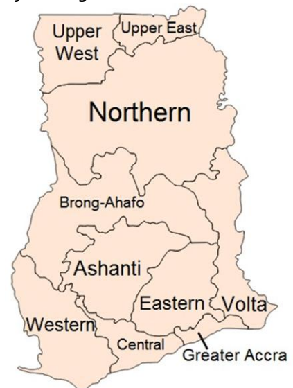
Afbeelding 2: Provincies in Ghana