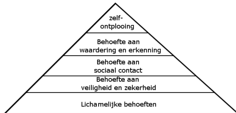
Figuur 2: Behoeftehiërarchie van Maslow.

Ook niet-kerkelijke waarden die jongeren nastreven hebben invloed op de mate van maatschappelijke participatie. Er is een verklaring te vinden in het nastreven van verschillende waarden van jongeren in de beschrijving van de postmaterialistische stroming van Inglehart (1997). De postmaterialistische stroming, zoals beschreven in Ultee, Arts en Flap (2009) is gebaseerd op de behoeftehiërarchie van Maslow. De behoeftehiërarchie van Maslow is weergegeven in de vorm van een piramide.