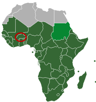
Figure 2 ("List of governors-general," 2021)