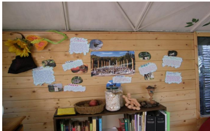
Aantekeningen met de positieve eigenschappen van de bewoners van Arboricolo die aan de muur hangen van de gemeenschappelijke eetkamer.