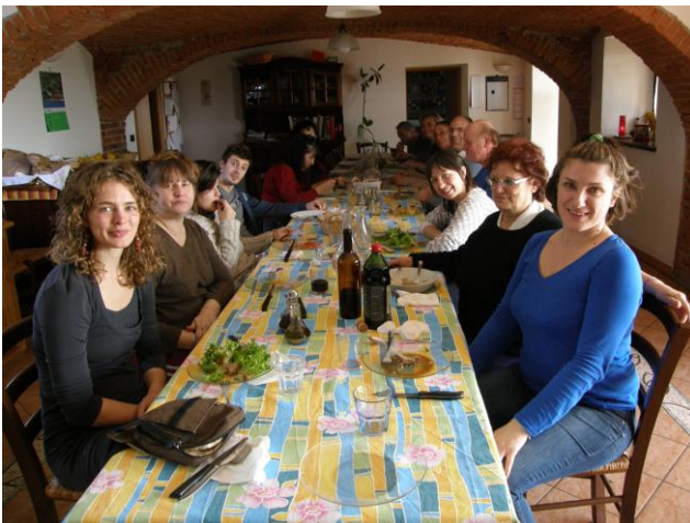
Aan tafel met de bewoners van Primastalla