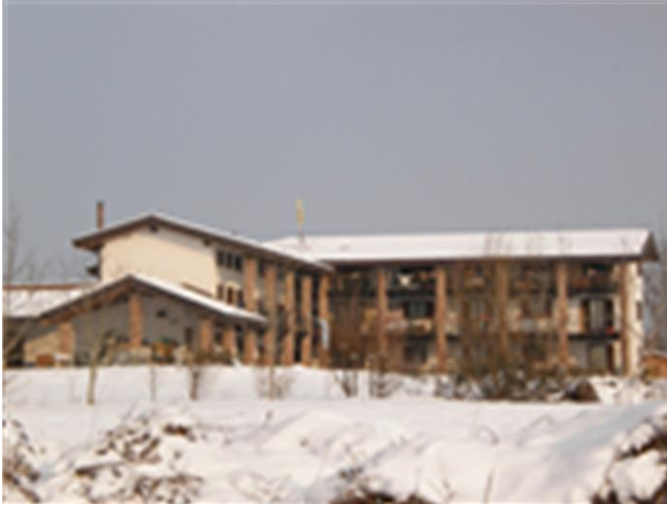
Nucleo Primastalla in februari 2012