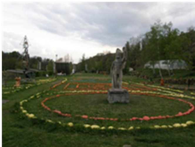
De spiralen voor loop-meditaties in Damjl .