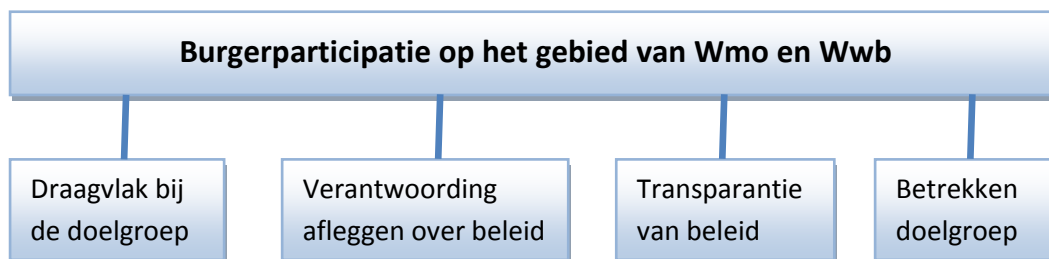
Figuur 2.1. Normatief kader voor voldoende burgerparticipatie op het gebied van Wmo en Wwb.

Via de wet heeft de rijksoverheid een normatief kader opgesteld voor burgerparticipatie bij de Wmo- en Wwb-doelgroep. De burgerparticipatie is voldoende als bij de Wmo-doelgroep maximaal draagvlak is voor het lokale Wmo-beleid, het beleid transparant is en wanneer er verantwoording wordt afgelegd over het beleid op lokaal niveau. Op het gebied van de Wwb is de burgerparticipatie voldoende als er een verordening cliëntenparticipatie is opgesteld en de Wwb-doelgroep of vertegenwoordigers van deze doelgroep worden betrokken bij de uitvoering van het Wwb-beleid. Het normatieve kader voor de Wmo- en Wwb-doelgroep is weergegeven in figuur 2.1.