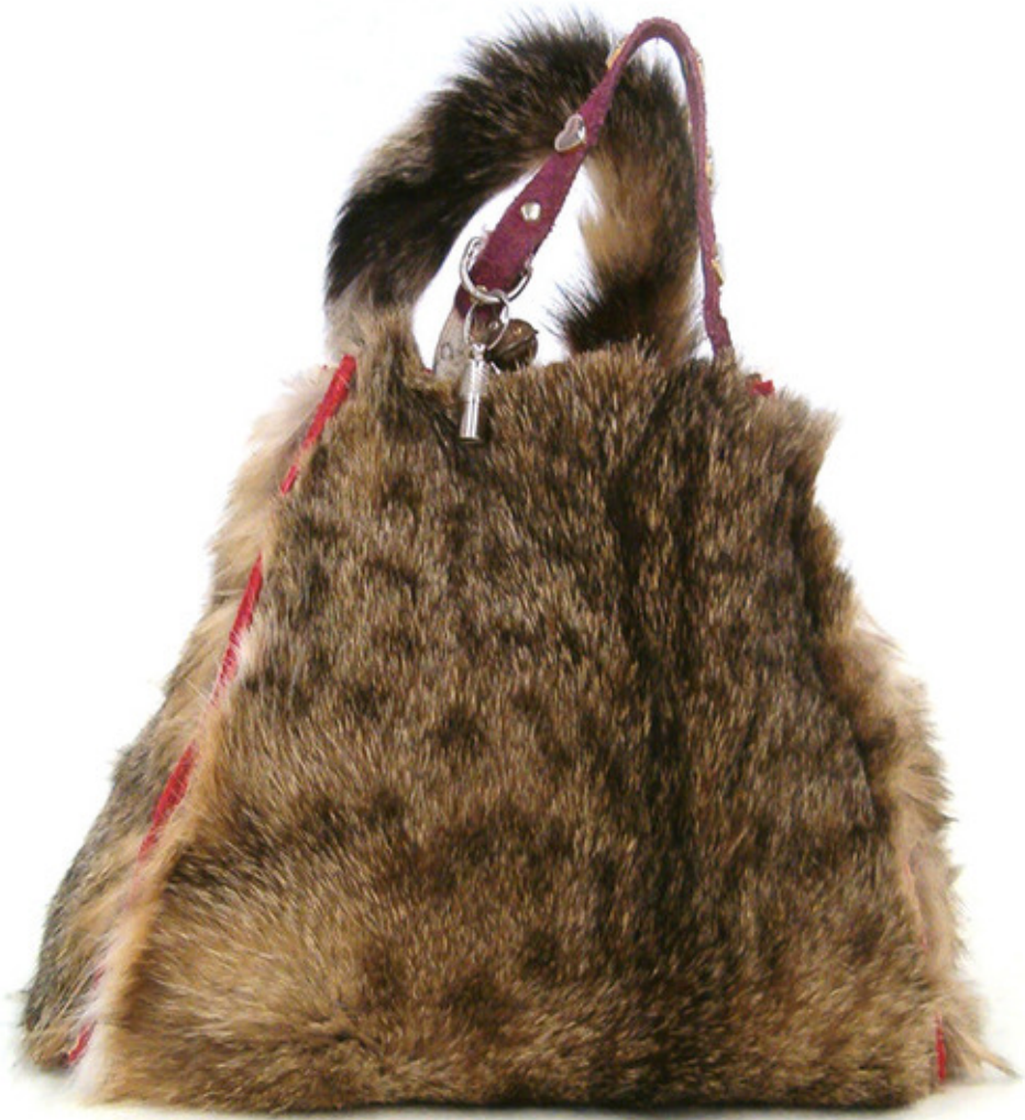
Tinkebell, 'My dearest cat Pinkeltje'