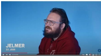
Afbeelding 15: scène 9

te beelden. Binnen interviews met deskundigen wordt er gebruik gemaakt van een statief waar de camera zonder beweging op staat, gepaard met medium close-ups. Hierdoor wordt de focus gelegd op de inhoud van de interviews, wat laat zien dat de informatie die hier gegeven wordt significant is voor het begrijpen van euthanasie als begrip. Om het statische karakter van de interviews met de deskundigen te doorbreken worden close-ups van zowel gezichten als handbewegingen toegepast.