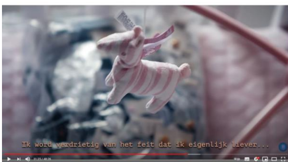
Afbeelding 13: scène 26

In scène 26 wordt het pillendoosje als rekwisiet op een andere wijze afgebeeld dan in scène vier. Hier wordt de focus verlegt van een muziekmobiel naar een berg pillen die in de achtergrond van het beeld zichtbaar is.