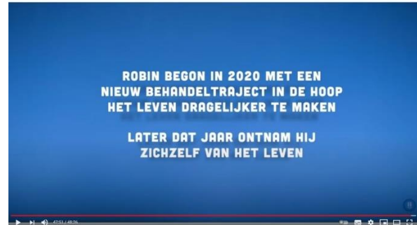
Afbeelding 5: scène 45

Het gebruik van de data wordt gebruikt als logisch bewijs, om aan te tonen dat het aanvragen van euthanasie heel lang duurt. De kijker ziet namelijk het begin in 2018, het midden in juni 2019, waar duidelijk wordt dat er nog steeds geen vooruitzicht bestaat door de zelfmoordpoging die besproken wordt, en in 2020 het einde, waar één personage maar net euthanasie krijgt en de ander gedwongen wordt tot zelfmoord. Het aanvragen van euthanasie duurt dus te lang.