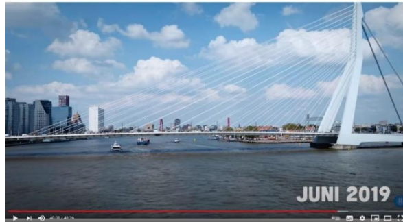
Afbeelding 3: scène 32

Daarnaast wordt bij een omslagpunt, zoals de mislukte zelfmoordpoging van Robin, die het einde van de documentaire inluidt, ook een datum afgebeeld. 64 Dit doet het team van BOOS om de kijker te laten zien hoe lang het duurt totdat iemand zelfmoord pleegt, wanneer diegene geen euthanasie kan aanvragen.