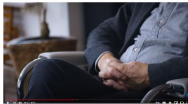
Afbeelding 18: scène 19