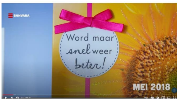
Afbeelding 1: scène 4

De rode draad die in het plot van de documentaire EUTHANASIE DE MOVIE centraal staat, betreft het proces van euthanasie aanvragen bij jongeren. In de documentaire is een duidelijk begin, middenstuk en einde aanwezig. Zoals in de synopsis naar voren komt, worden in het begin de personages en hun problemen afgebeeld, in het middenstuk zien we dat de problemen groter worden door een kind en zelfmoord en het einde draait om het uiteindelijke overlijden van de personages. Om de chronologie van het proces van euthanasie aanvragen bij jongeren aan te tonen binnen de documentaire worden concrete data afgebeeld. 62 Om duidelijk te maken wanneer de documentaire begint, wordt door middel van de tekst “mei 2018” aangegeven dat het team van BOOS Athaliah begint te volgen. Bij Robin wordt hetzelfde gedaan met de tekst “december 2018”. 63