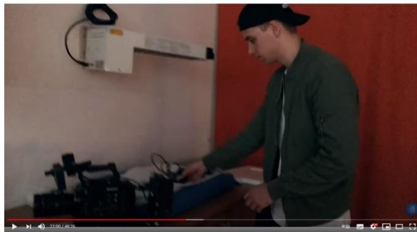
Afbeelding 20: scène 22

Ten slotte valt het op hoe er nadruk wordt gelegd op het filmproces zelf. Dit wordt gedaan door met opzet camera's in beeld te tonen, te benoemen dat er met een iPhone gefilmd wordt en materiaal wat normaal buiten beeld blijft, te filmen. Tijdens de scène waar Athaliah bevalt van Sevyn wordt expliciet benoemd dat er op dat moment met minder kwaliteit gefilmd wordt. 90