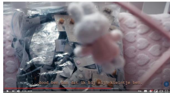
Afbeelding 14: scène 26

Door deze rekwisieten zo zorgvuldig in beeld te leggen en vervolgens zo nauwkeurig weer te geven wordt er een metaforische betekenis door de kijker aangehangen, namelijk de verlegde focus van Athaliah van haar dochter naar de ziekte waaraan ze alsnog zal sterven. De weergave van deze pillen wordt als pathetisch bewijs gebruikt om aan de ene kant de liefde voor Sevyne aan te tonen en aan de andere kant de ziekte die haar dwingt tot euthanasie.