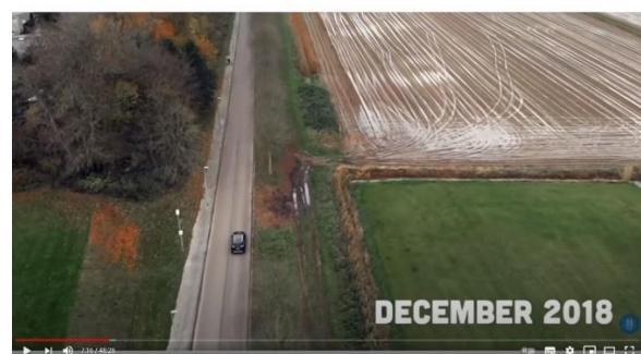
Afbeelding 2: scène 4