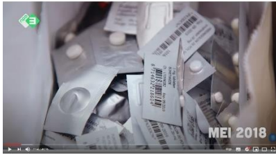
Afbeelding 10: scène 4