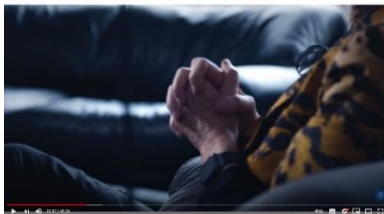
Afbeelding 17: scène 6