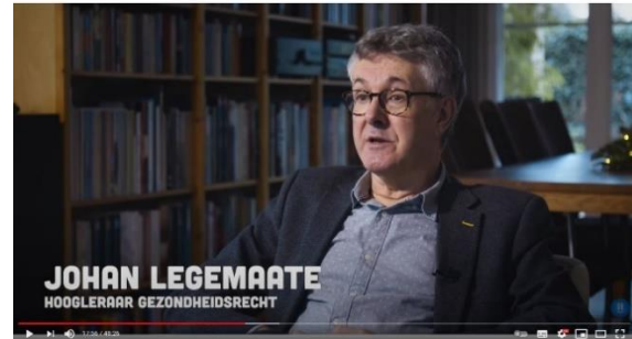
Afbeelding 9: scène 17

Casteelen en Legemaate worden ingezet om een deskundige blik te geven op de regels en eisen die bij een euthanasieaanvraag naar voren komen en hoe deze worden gelegitimeerd. Door zowel een blik van ervaringsdeskundigen als deskundigen in het veld van euthanasieaanvragen te tonen, wordt er een evenwichtig ethisch bewijs gecreëerd, waarmee het team van BOOS laat zien dat euthanasie op zichzelf een ingewikkeld onderwerp is dat ze naast de verhalen van de twee hoofdpersonages ook objectief willen benaderen en waar nodig behapbaar willen maken, zodat er geen misverstanden ontstaan over de definitie. Om het perspectief van euthanasie zo duidelijk en compleet mogelijk te maken, worden deskundigen ingezet, anders dan binnen het voluntary euthanasia discourse , waar Hausmann betoogt dat de betekenissen van euthanasie door experts nooit bevroegd worden. 83