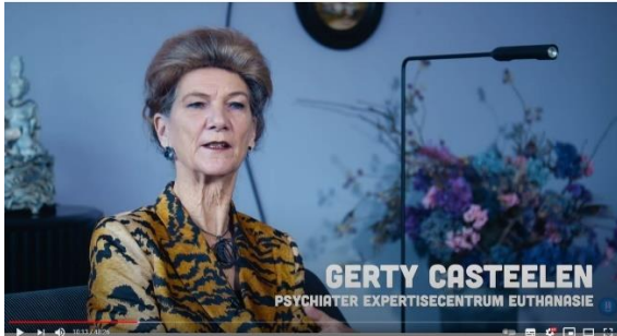
Afbeelding 8: scène 6

hoogleraar Gezondheidsrecht. Beide deskundigen worden in hun eigen kantoor afgebeeld en worden dus als autoriteit gezien, waardoor hun inbreng als significant geacht wordt. 82