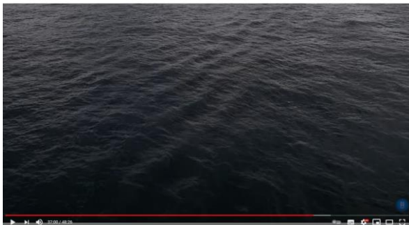
Afbeelding 22: scène 29

Dit donkere water komt verder steeds voor tussen scènes waar Robins verhaal verteld wordt. 91 Het zwarte water wordt voor de kijker eerst gezien als overgangen tussen scènes, zonder de verdere betekenis te weten. Het donkere water krijgt echter later betekenis, wanneer we erachter komen dat dit één doorlopend droneshot is dat in scène 29 eindigt bij de Erasmusbrug.