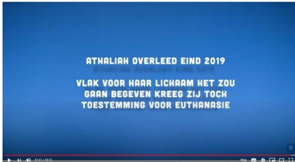
Afbeelding 4: scène 44

Om het werkelijke einde van het proces aan te duiden, wordt in scène 44 met tekst aangetoond dat het volgen van de personages ophoudt aan het einde van het jaar 2020, wanneer Robin uiteindelijk zelfmoord pleegt. 65