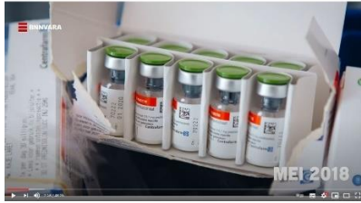
Afbeelding 11: scène 4