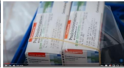
Afbeelding 12: scène 4

In scène 26 wordt het pillendoosje als rekwisiet op een andere wijze afgebeeld dan in scène vier. Hier wordt de focus verlegt van een muziekmobiel naar een berg pillen die in de achtergrond van het beeld zichtbaar is.