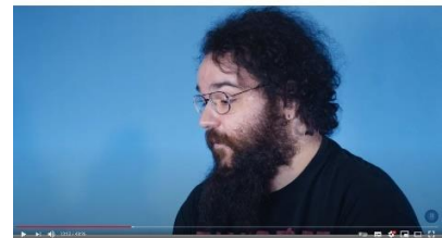
Afbeelding 16: scène 10