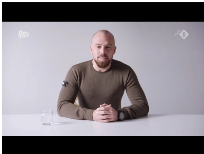
Aflevering negen Kamp Van Koningsbrugge