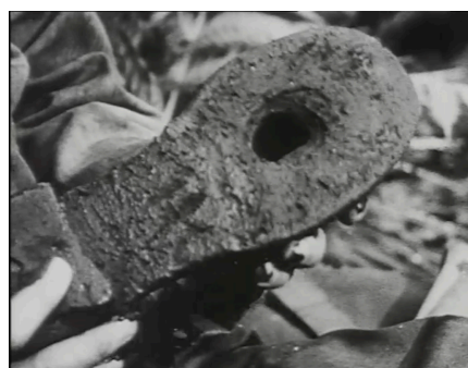
Afbeelding 3: Fragment uit DE ONDERGANG VAN DE B-COMPAGNIE (1945).

voornamelijk om het zo goed mogelijk onderhouden van het materiaal. In deze instructiefilm komen normen ten aanzien van gedrag en houding veelvuldig voor. De hoofdrolspeler is een soldaat die lak heeft aan alle regels die hem worden voorgeschreven. Doordat hij deze regels niet naleeft gebeuren er steeds vervelende dingen met hem. Een voorbeeld uit de film is dat hij de zolen van zijn schoenen niet heeft laten vervangen. Hierdoor stapt hij op een gegeven moment in een stekel en door zijn oude schoenen met versleten zolen gaat de stekel dwars door zijn voet heen (zie afbeelding 3). Er wordt dus van hem verwacht dat hij zich op een bepaalde manier gedraagt en hij doet wat er van hem gevraagd wordt. En omdat het een instructie is wordt er van de kijker verwacht dit gedrag te volgen en zich dus ook houdt aan bepaalde manier van handelen die hem wordt voorgeschreven. Hierin zit ook gelijk het doel van de film. Volgens Jowett en O'Donnell kun je het doel van propaganda achterhalen door te kijken hoe de propagandist het publiek probeert te beïnvloeden of een bepaald gedrag probeert aan te leren 32 . De instructiefilm DE ONDERGANG VAN DE B-COMPAGNIE probeert een bepaald gedrag aan te leren en in zekere zin ook het publiek, de soldaat, te beïnvloeden in de manier waarop de makers denken dat de soldaat moet fungeren.