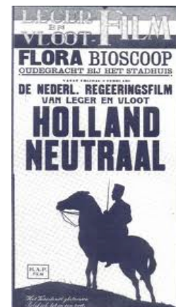
Afbeelding 1: de “eerste” propagandafilm HOLLAND NEUTRAAL.

Deze opdrachtfilm werd dus gemaakt om het buitenland duidelijk te maken dat de Nederlandse neutraliteit in de Oorlog geen fictie was. Op 9 januari 1917 kwam de film onder de naam HOLLAND NEUTRAAL (ook wel DE LEGER- EN VLOOTFILM genoemd, zie afbeelding 1) in de bioscoop. Het was de eerste lange documentaire waar een groot publiek in de bioscoop naar kwam kijken. Daarnaast werd de film ook bestempeld als Nederlands eerste propagandafilm 12 . Of het daadwerkelijk de allereerste propagandafilm is geweest kan in twijfel worden getrokken. Immers, na het ontstaan van het medium film werden in Nederland