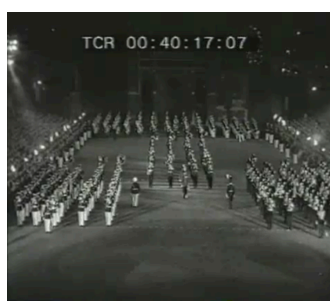
Afbeelding 4: Parade Taptoe delft.

JE MAINTIENDRAI kwam iets later uit dan de instructiefilm, maar speelde ongeveer in dezelfde context. De overheid was nog steeds alert op propagandistisch materiaal en wilde daar niet meer mee geassocieerd worden. In de film zien we soldaten op muziek over een plein marcheren (zie afbeelding 4). Dit beeld kan teruggekoppeld worden naar de parades van Hitler in de Tweede Wereldoorlog, waarbij zijn leger massaal in de straten van de veroverde steden marcheerde (zie afbeelding 5). Daarnaast werd tijdens deze parades ook de leider, Hitler zelf, verheerlijkt. Dit komt ook terug in de Taptofilm waarbij het Koningshuis meermaals in beeld komt. Daarom is de context van belang, omdat het begrijpelijk is waarom deze film snel als propagandistisch werd bestempeld, de nare smaak van propaganda zat nog vers in het geheugen.