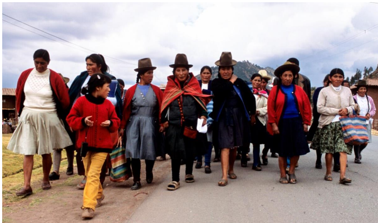
Figuur 1. Inheemse Peruviaanse vrouwen. - Caso de esterilizaciones forzadas depende del Tribunal Constitucional, La República , https://larepublica.pe/politica/2019/09/21/alberto-fujimori-caso-de-esterilizaciones-forzadas-depende-del-tribunal-constitucional-costa-bauer-solicito-anular-proceso-ministerio-publico-video/ (2019) (geraadpleegd op 30-03- 2021).

Een onderzoek naar de gedwongen massasterilisatie in Peru gedurende 1996-2000