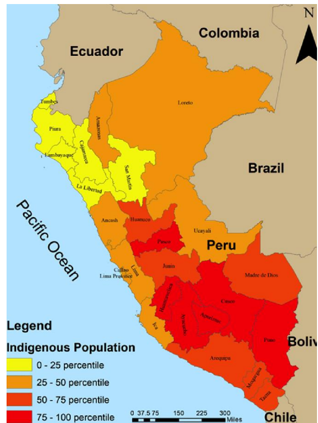
Figuur 4: Kaart inheemse gemeenschappen in Peru

De vorige hoofdstukken lieten zien in welke context de ongewenste sterilisaties konden plaatsvinden. De verschillende niveaus toonden op welke wijze het beleid tot stand kwam en welke story-lines hierin een rol hebben gespeeld. Met deze kennis wordt nu gekeken naar de manier waarop de inheemse vrouwen onderhevig waren aan het beleid. In dit hoofdstuk staat door middel van een discoursanalyse aan de hand van 174 getuigenissen afkomstig van het Quipu-project, het perspectief van de inheemse vrouwen centraal. De vrouwen die aan bod komen in de getuigenissen komen grotendeels van het platteland van Peru, variërend van het noordelijke Andes gebied, Anta, Cusco en Ayacucho tot het Zuidelijke deel van de Andes en Pucallpa in het Amazonegebied. Zoals te zien is op het kaartje is de inheemse bevolking verspreid over heel Peru, waarbij in het zuiden tussen de 75 en de 100% uit van de populatie inheems is. 105