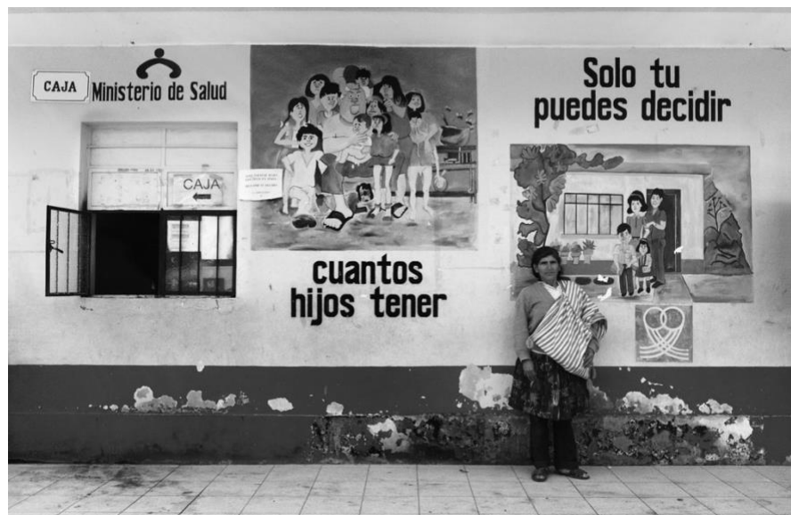
Figuur 3: Anticonceptiereclame op straat

Naar aanleiding van de speech van Fujimori in Beijing herwon Peru financiële steun vanuit Amerika voor het gezinsplanningsbeleid.