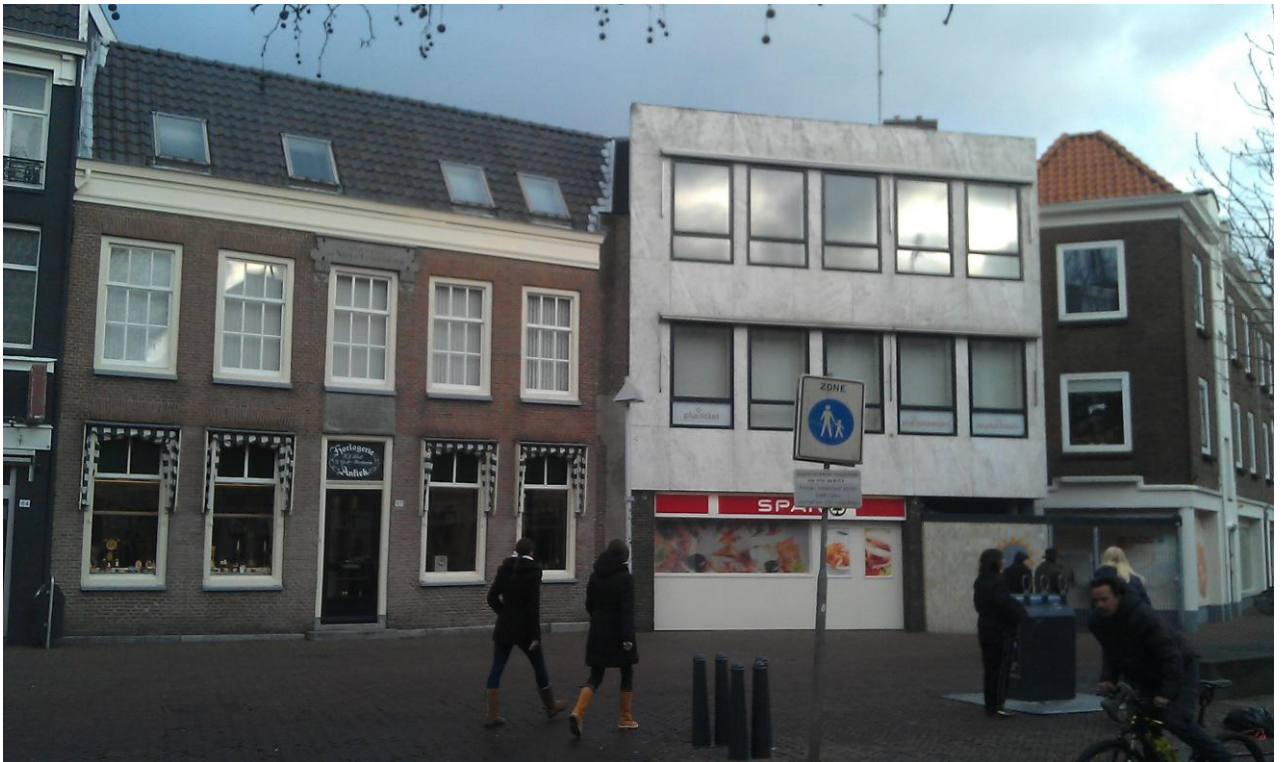
Het huis Over den Broeren aan de Broerenstraat in 2012.