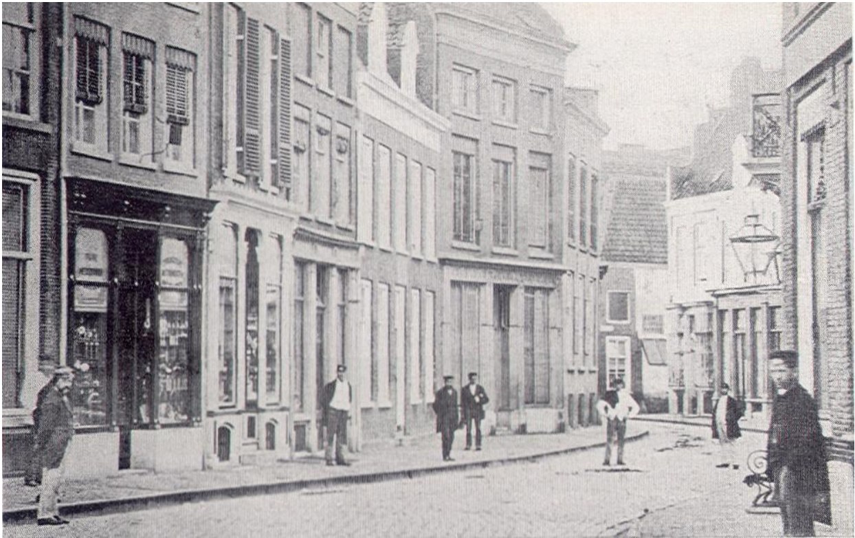
Broerenstraat rond 1900. Het vierde gebouw aan de linkerkant is het huis Over den Broeren.